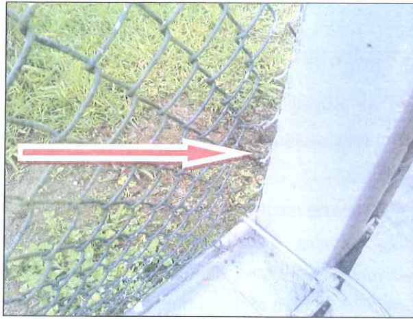
Figura 2: Tela rompida