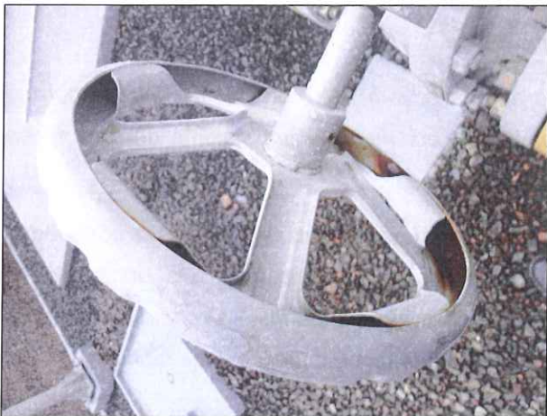
Figura 4: Corrosão no volante de válvula

DETERMINAÇÃO 03: Deve ser feita a restauração de todos os pontos danificados pela corrosão nos equipamentos da estação (figuras: 4 e 5).