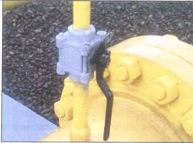
Figura 6: Válvula com pintura em desacordo com as especificações técnicas da SCGÁS

CONSTATAÇÃO 05: Falta mapa de risco e placa com instruções de segurança na estação.