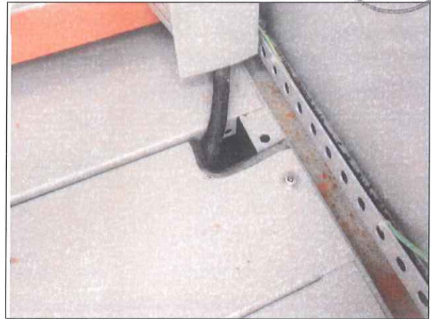
Figura 9: Entrada de cabos sem vedação