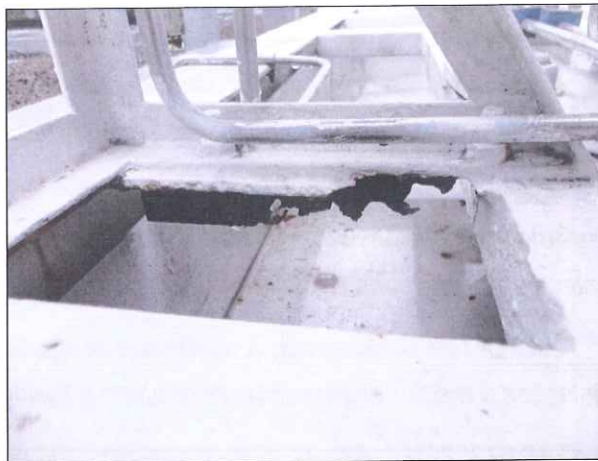
Figura 3: Corrosão na estrutura do SDO

DETERMINAÇÃO 02: Deve ser feita a restauração de todos os pontos danificados pela corrosão na estrutura do SDO e a pintura deve estar de acordo com o estabelecido no Procedimento PR – 40.300.SCG.107 da SCGÁS. (figura 3).