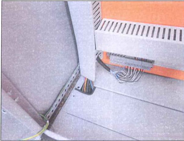
Figura 8: Entrada de cabos sem vedação

animais no interior do equipamento (Figuras: 8 e 9).