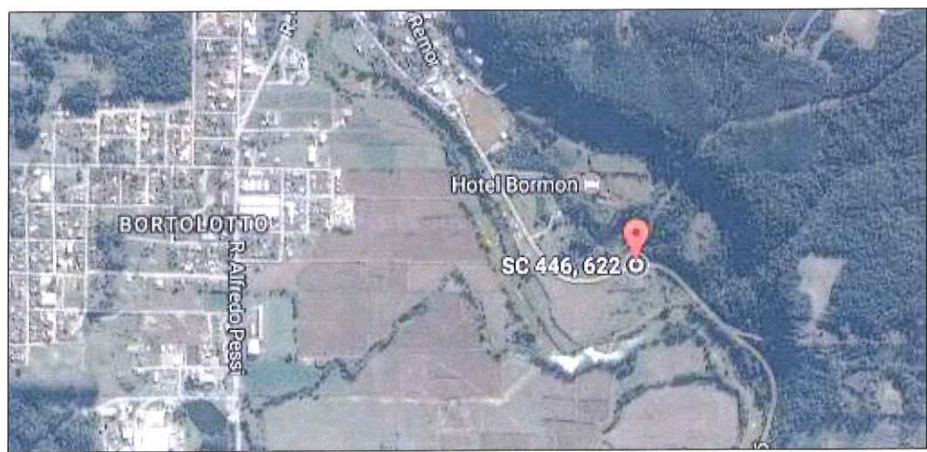
Figura 1: Imagem da localização da ER 09 de Nova Veneza.