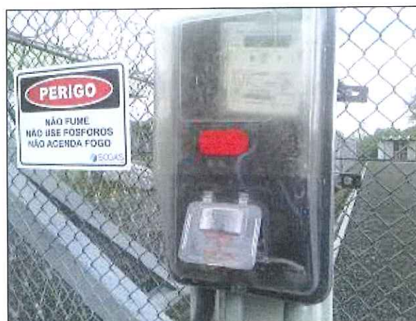
Figura 7: Medidor de energia sem cadeado.

RECOMENDAÇÃO 01: Colocar cadeado no medidor de energia a fim de evitar a falta de energia provocada por vandalismo. (Figura 7).