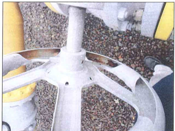
Figura 5: Corrosão no volante de válvula

CONSTATAÇÃO 04: Válvula com pintura realizada em desacordo com o Procedimento PR – 40.300.SCG.107 da SCGÁS.