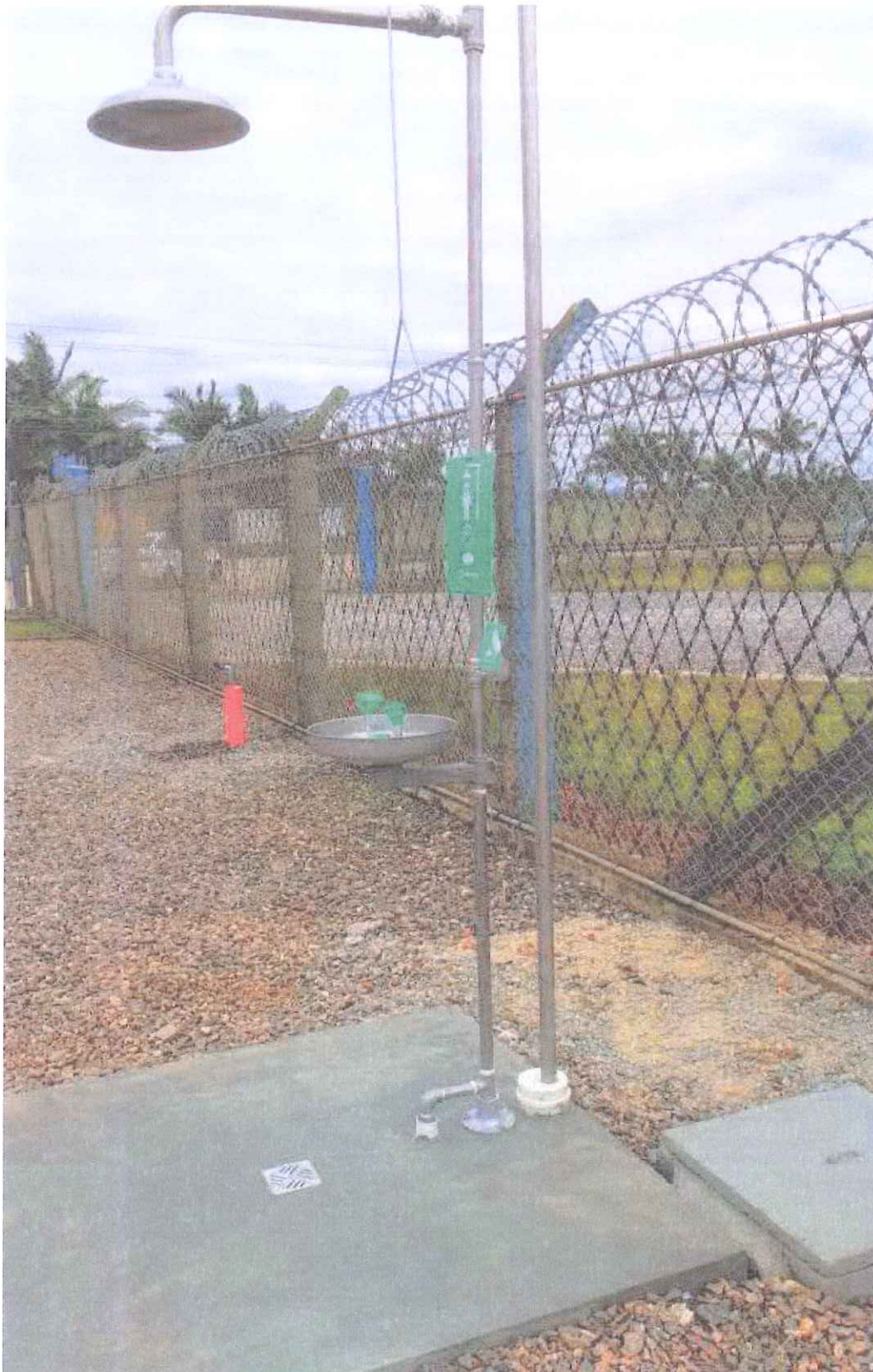
ER5 – Tijucas