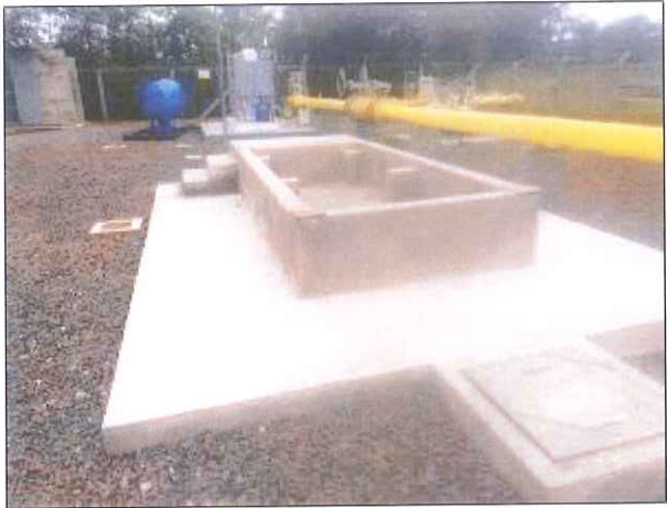
Figura 02: Base do novo Sistema de Odoração-SDO.

CONCLUSÃO DA ARESC: O Procedimento PR – 40.300.SCG.107 da SCGÁS não se aplica a estrutura avaliada. No entanto, está sendo construída nova estrutura para o Sistema de Odoração com capacidade para 2.000 litros (figuras 02 e 03), maior que o anterior, e está em fase final de montagem, o qual extingue o problema de corrosão obtido na Constatação 02.