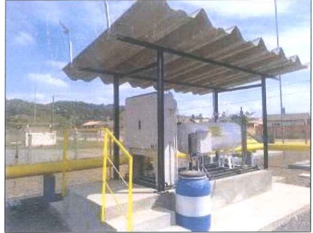
Figura 2 - Quadro de controle e novo sistema de odoração (Fonte: SCGÁS, 2018).