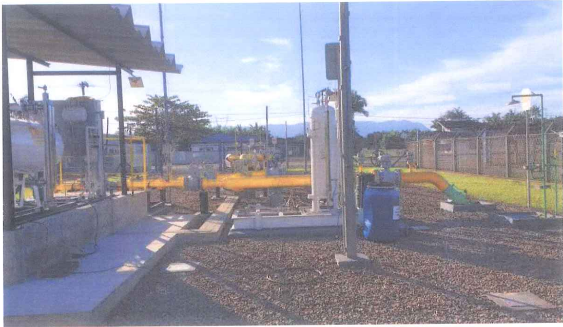
ER1 - Joinville