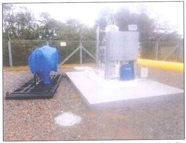
Figura 03: Novo Sistema de Odoração-SDO à ser instalado.

CONSTATAÇÃO 03: Vários equipamentos da estação com pontos de corrosão e pintura inadequada.