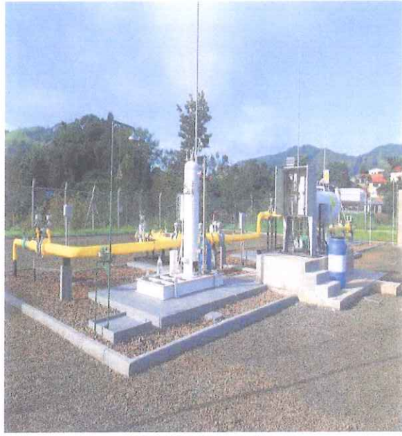
ER 7 – Tubarão