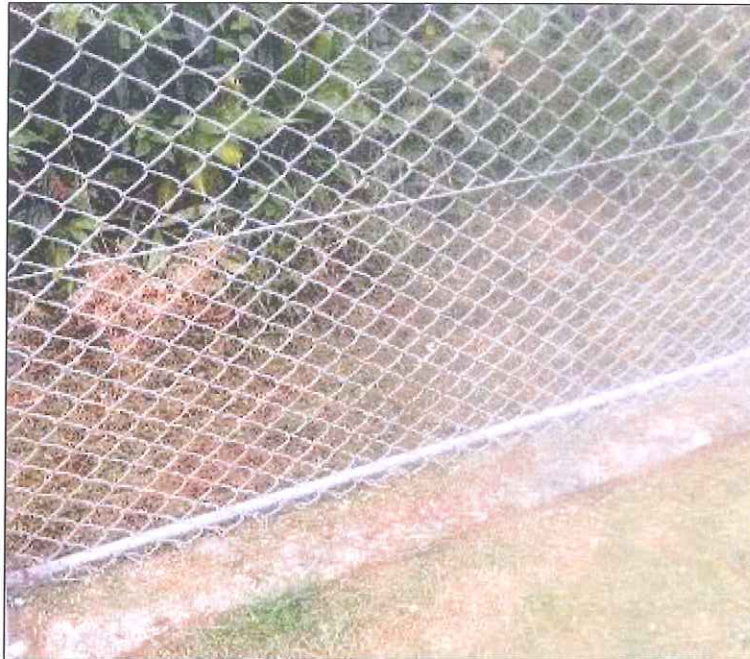
Figura 01: Tela restaurada.

CONCLUSÃO DA ARESC: Determinação foi cumprida nesta vistoria de acompanhamento, sendo restauradas todas as cercas de proteção (figura 01).