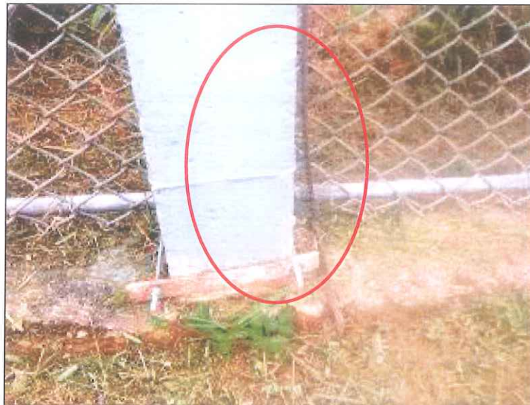
Figura 08: Cabo de aterramento recuperado.

CONCLUSÃO DA ARESC: A determinação foi cumprida, houve a substituição do cabo de aterramento (figura 08). Além disso, foi constatado que os equipamentos utilizados nas atividades de supressão de vegetação já utilizam somente fio de nylon como agente de corte, suprindo a recomendação sugerida.