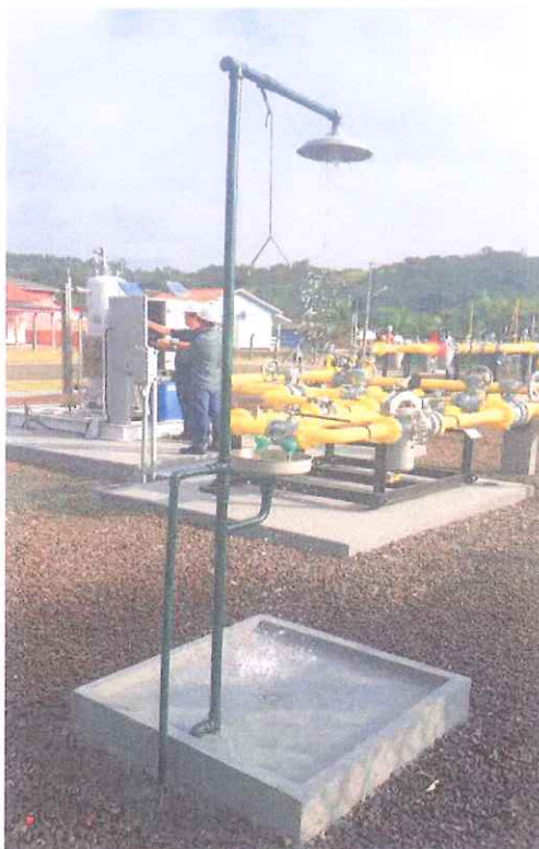
ER 8 – Urussanga.