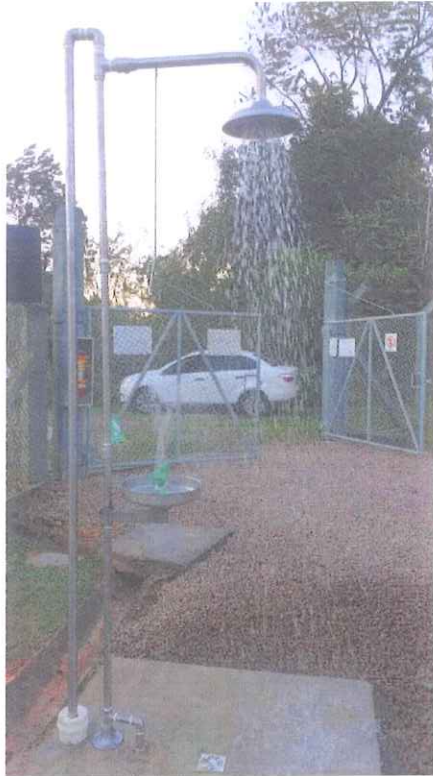
ER4 - Brusque