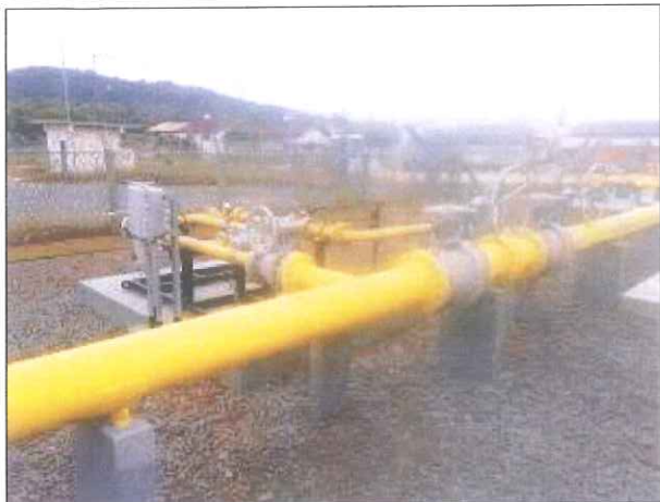
Figura 04: Junção com pintura adequada.