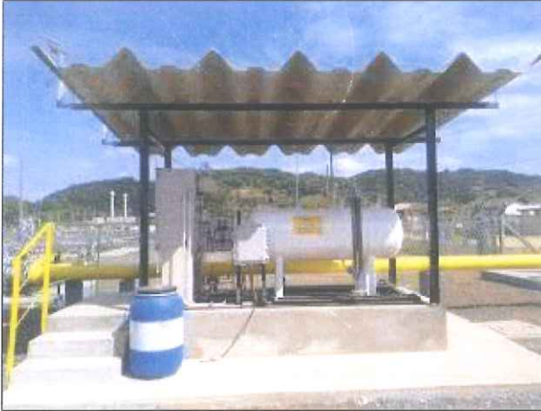
Figura 1 - Lateral direita do novo sistema de odoração.

Fotos enviadas pela SCGÁS por meio do ofício SCGÁS DE -069-18. Tratam da instalação da nova estrutura do sistema de odoração da estação de recebimento de Gaspar ER-03.