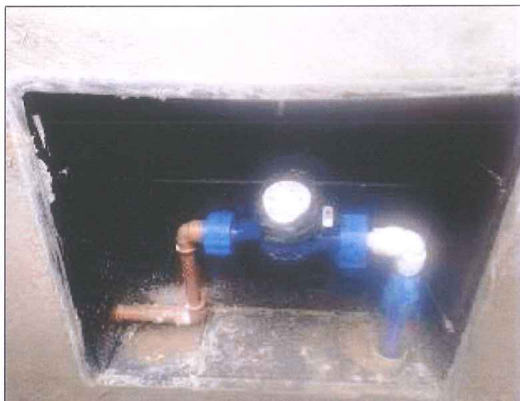
Figura 07: Ligação de entrada d'água.

CONCLUSÃO DA ARESA: Determinação não foi cumprida nesta vistoria de acompanhamento. No entanto, para o devido cumprimento, conforme ofício SCGÁS - DE-069-18, inicialmente foi instalada a ligação de entrada de água (verificado in loco pela Aresa - figura 07) e posteriormente será instalado o equipamento Lava-olhos.