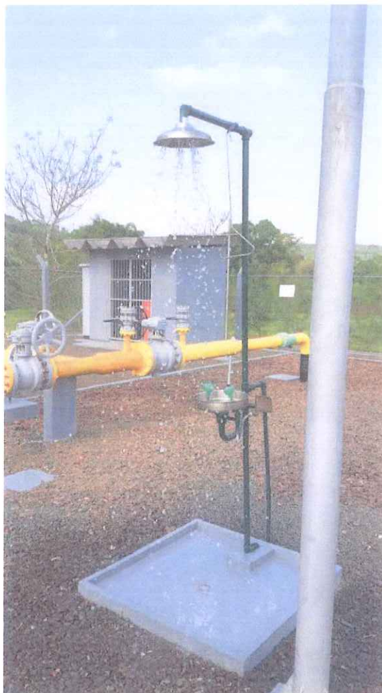
ER9 - Nova Veneza