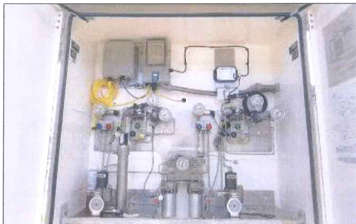
Figura 3 - Quadro de comando do novo sistema de odoração (Fonte: SCGÁS, 2018).