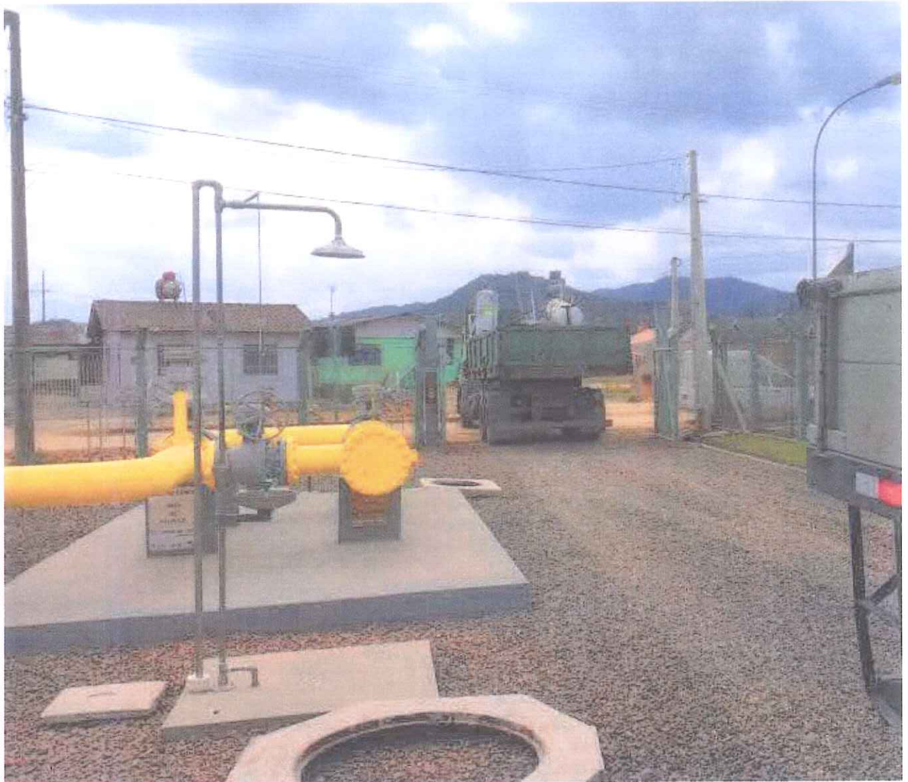
ER3 – Gaspar