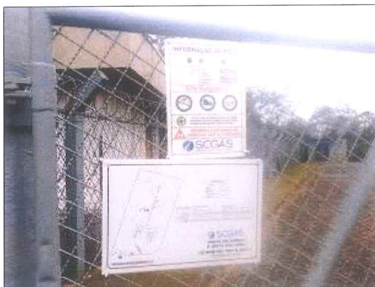
Figura 06: Mapa de risco.

CONCLUSÃO DA ARESC: Foram providenciadas e instaladas as placas de mapa de risco e instruções de segurança, conforme mostrado na figura 06.