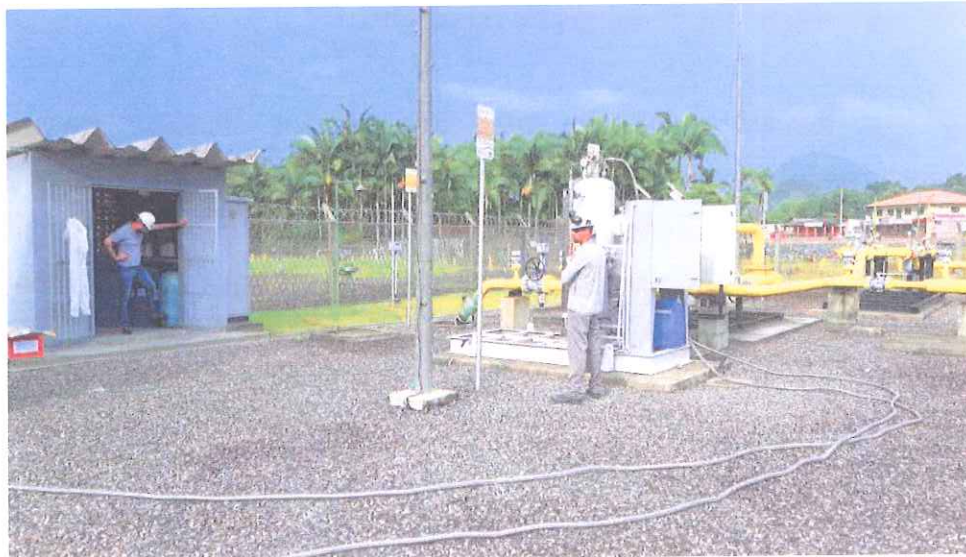
ER2 - Guaramirim