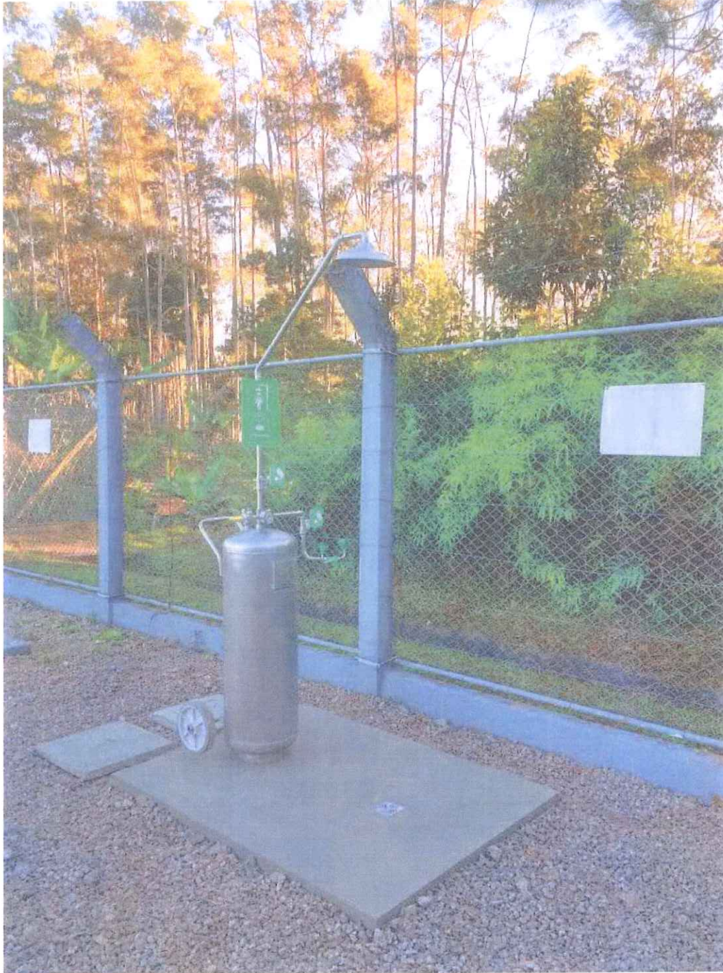
ER 6 - São Pedro de Alcântara