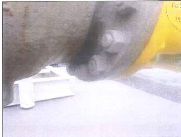
Figura 05: Junção com pintura adequada.

CONSTATAÇÃO 04: Faltam placas com mapa de risco, restrição de acesso e instruções de segurança na estação.