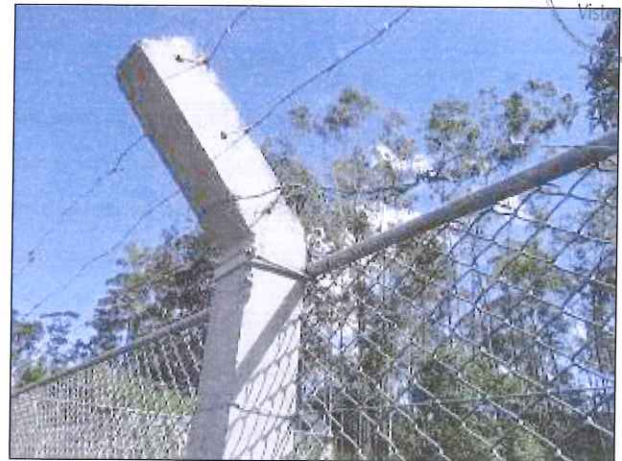
Figura 3: Arame farpado danificado