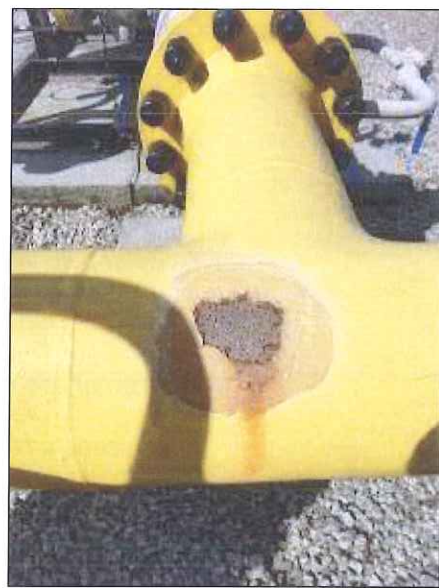
Figura 7: Ferrugem na Tubulação.