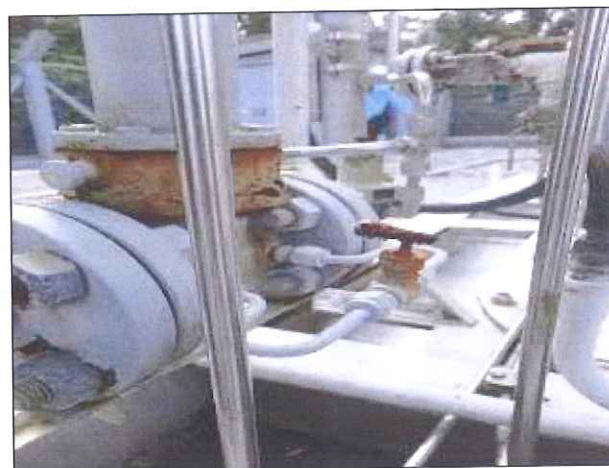
Figura 5: Componentes e válvulas com ferrugem

CONSTATAÇÃO 03: Válvulas, tubulações e conexões com vários pontos com corrosão.