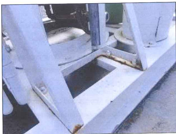
Figura 4: Base da estrutura com ferrugem

DETERMINAÇÃO 02: - Deve ser feita a restauração de todos os pontos danificados pela corrosão na estrutura do SDO (fig. 3 e 4).