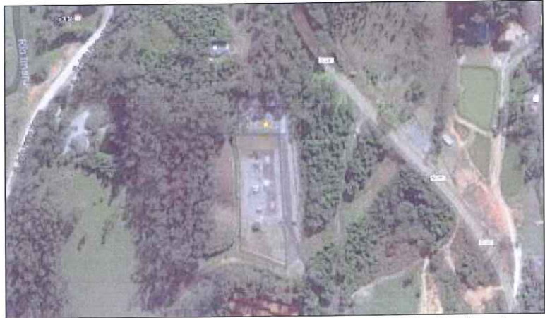
Figura 1: Imagem da localização da ER 06 São Pedro de Alcântara.

[Handwritten signatures and initials in blue ink]