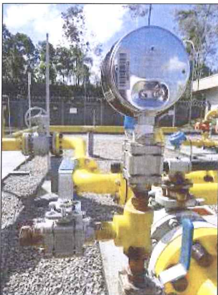
Figura 6: Ferrugem em conexões e válvulas

DETERMINAÇÃO 03: Devem ser feitas as restaurações de todos os pontos danificados pela corrosão nos equipamentos da estação e dos pontos de conexão da proteção catódica (figuras: 5, 6 e 7). Informamos que as figuras servem apenas como exemplo dos problemas encontrados, devendo a concessionária reparar todos os demais pontos não conformes.