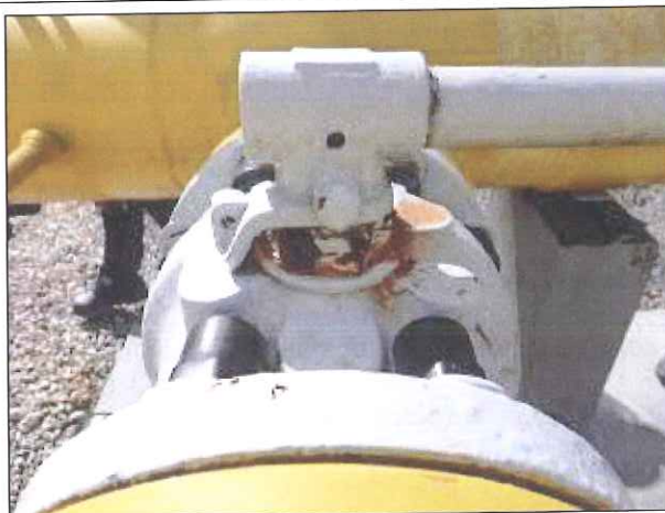
Figura 7: Ferrugem em válvula.

CONSTATAÇÃO 04: Falta mapa de risco e placa com instruções de segurança na estação.