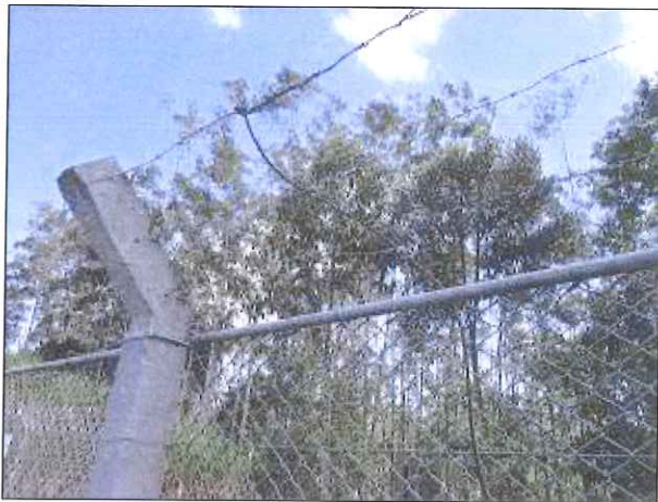
Figura 2: Ligações de aterramento precário