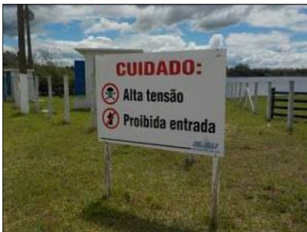
Figura 13: Detalhe da entrada da captação Lagoa da Serra