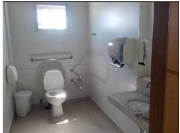
Figura 4: Vista interna do sanitário adaptado.