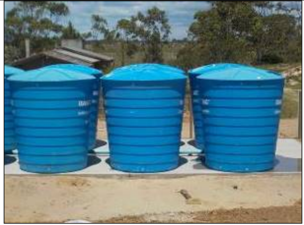
Figura 12: Vista dos Reservatórios na ETA II.