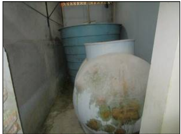
Figura 26: Produtos químicos dispostos no Almoarifado da ETA I.