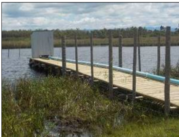
Figura 7: Manancial de Captação Lagoa Guairacá deverá entrar em operação a partir de novembro/2020.