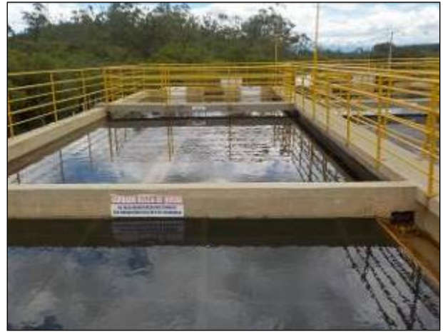
Figura 18: Detalhes dos decantadores da ETA I.