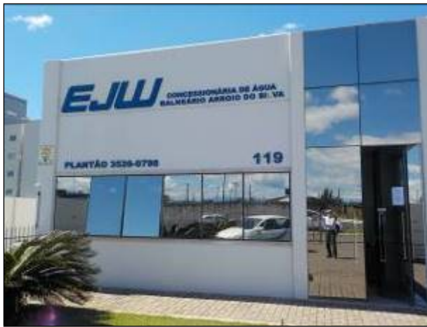
Figura 1: Vista externa do Escritório de Atendimento em Balneário Arroio do Silva.