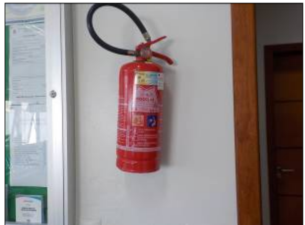
Figura 6: Aparelho contendo produto extintor de incêndio do tipo BC disponível na sala de atendimento.