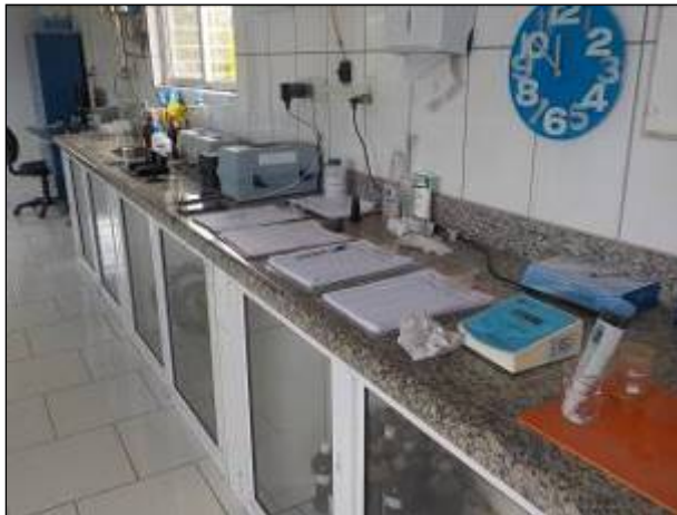
Figura 24: Equipamentos disponíveis para o laboratório na ETA I.