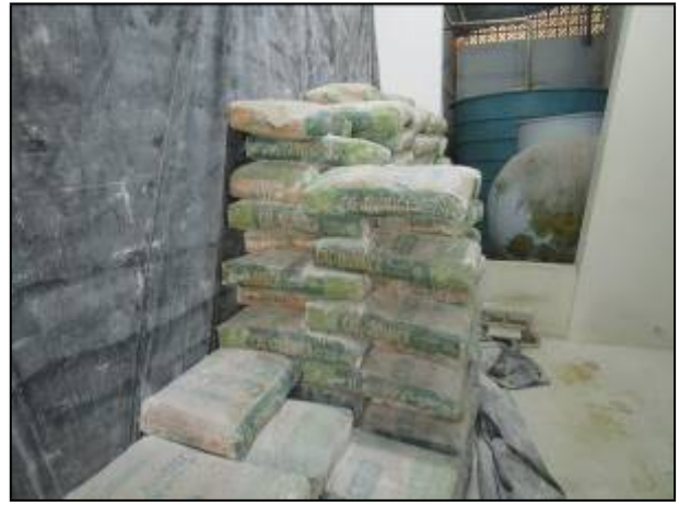
Figura 25: Produtos químicos dispostos no Almoarifado da ETA I.