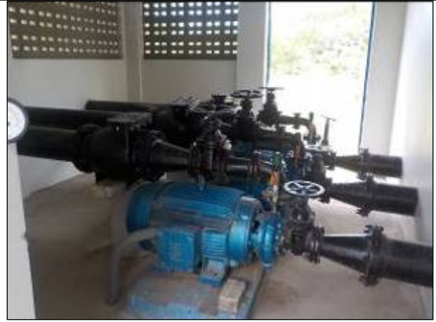
Figura 22: Moto bombas da Estação de Recalque da ETA I.