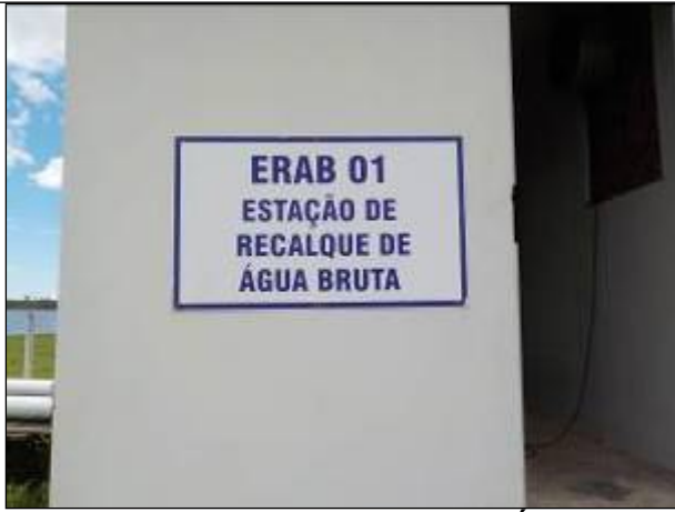
Figura 15: Estação de Recalque de Água Bruta (ERAB) Lagoa da Serra.