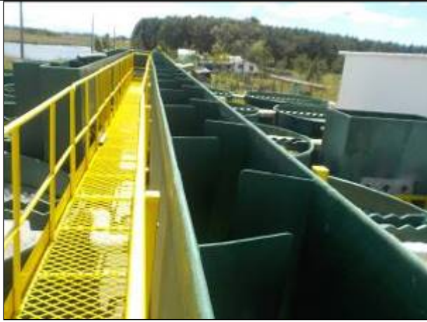
Figura 11: Entrada da água bruta captada da Lagoa Guairacá para ETA II.