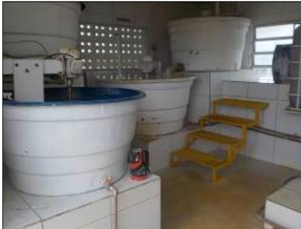
Figura 23: Casa de química na ETA I.