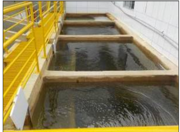
Figura 20: Filtros da ETA I.