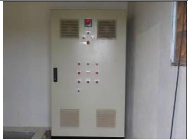
Figura 16: Quando de Comando da ERAB I.