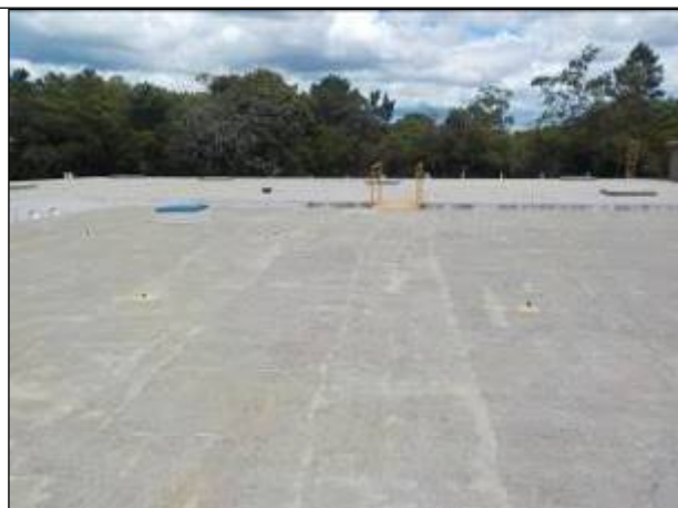
Figura 27: Reservatórios R1 e R2, localizados junto à ETA I.