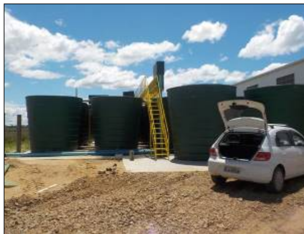
Figura 8: Vista da ETA II a partir da escada de acesso para suas estruturas, finalização das obras, novembro/2020.