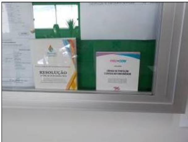
Figura 5: Manuais, Resolução Aresc e CDC.