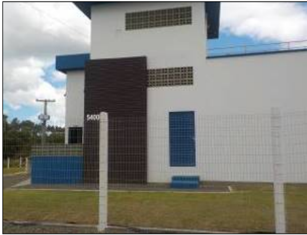
Figura 17: Vista da entrada da ETA I.