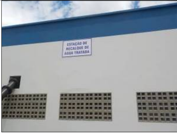
Figura 21: Vista de entrada da Estação de Recalque de Água da ETA I.