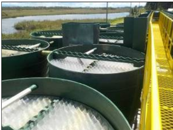
Figura 9: Estrutura da Nova ETA II.