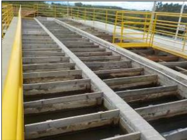
Figura 19: Detalhes dos floculadores da ETA I