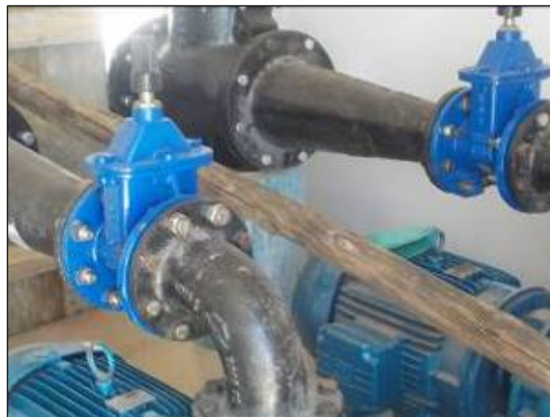
Figura 10: Estação de Recalque da nova ETA II, não operando.