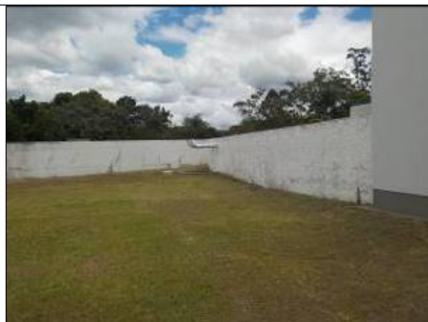
Figura 28: Vista dos Reservatórios R1 e R2.