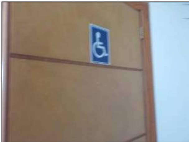
Figura 3: Sanitário específico para pessoas com deficiência sinalizado.