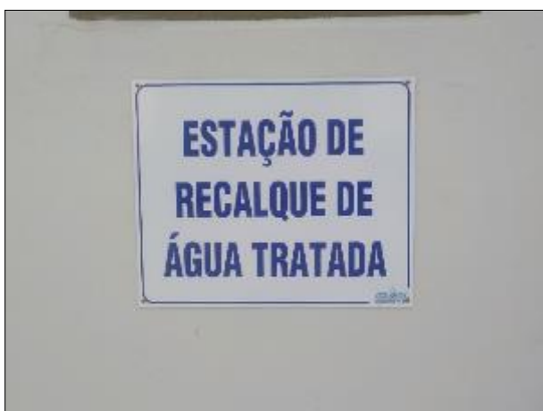
Figura 50: Vista da placa afixada na parede externa da ERAT da ETA II.