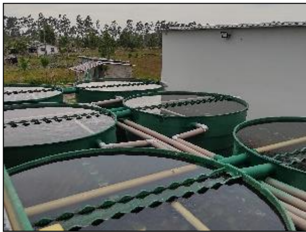
Figura 13: Vista dos decantadores, estes que ficam no entorno da calha de floculação e recebem suas águas.