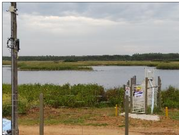
Figura 3: Vista da Lagoa do Guairacá e da estrutura de captação da água bruta.