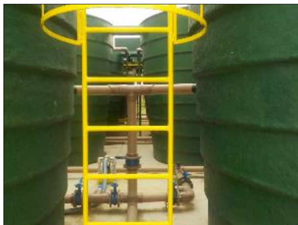
Figura 17: Vista de parte da escada de acesso e do encanamento que leva o lodo acumulado na parte inferior dos decantadores ao compartimento que o adensa.