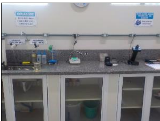
Figura 32: Vista da bancada contendo os equipamentos para análise e os armários para guardá-los.