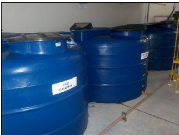
Figura 38: Vista dos recipientes contendo os produtos químicos utilizados no tratamento da ETA II.