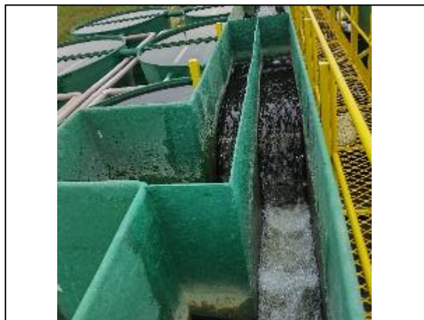
Figura 23: Vista da saída do floculador, estágio anterior à entrada de água nos decantadores