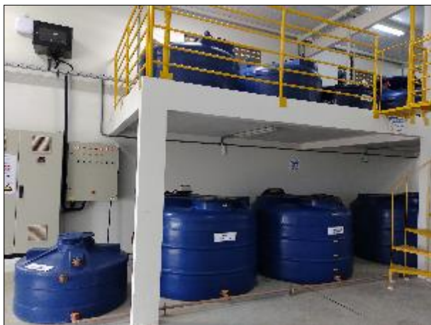
Figura 36: Vista da Casa de Química, na parte inferior os que estão em uso e na parte superior os estoques