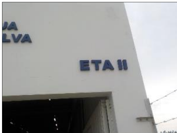
Figura 31: Vista da entrada da edificação com a sinalização do nome do local.