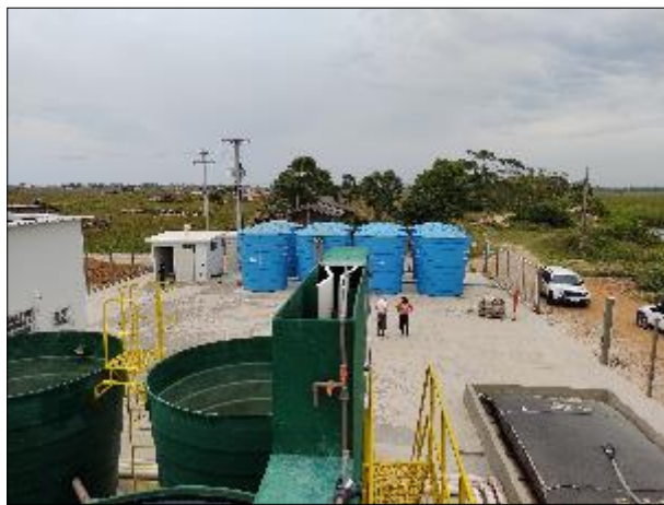
Figura 25: Vista da Calha Parshall (entrada da ETA) escadas de acesso e área de descarte do lodo. Ao fundo os reservatórios.