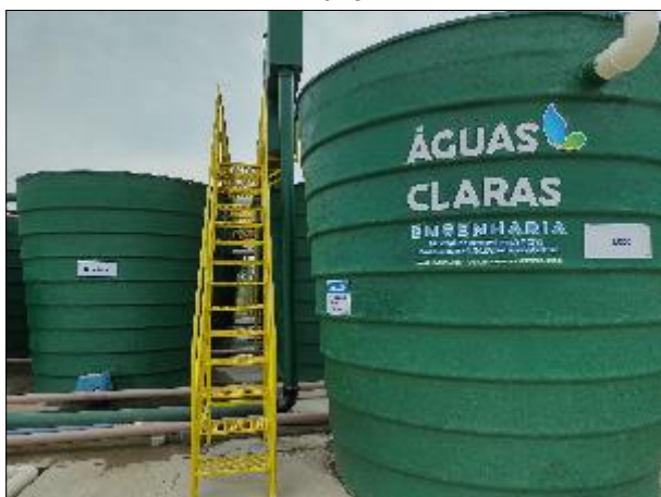
Figura 10: Vista dos equipamentos e escada de acesso à ETA II.