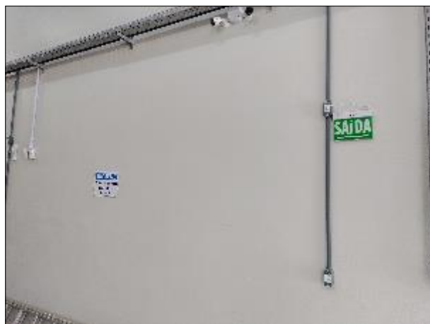
Figura 35: Vista das placas indicativas na edificação contendo os filtros e casa de química.