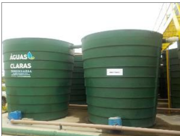
Figura 20: Vista da parte externa inferior dos decantadores e seus encanamentos.