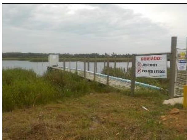
Figura 4: Vista da Área de Captação e acesso à ERAB Lagoa do Guairacá, com sinalização e cercamento adequados.