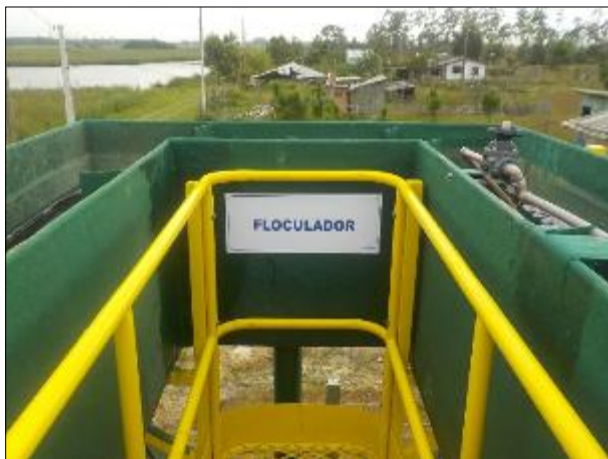
Figura 22: Vista da passarela de apoio aos operadores e da indicação da calha de floculação e placa indicativa.