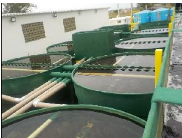
Figura 14: Vista dos decantadores, estes que ficam no entorno da calha de floculação e recebem suas águas.