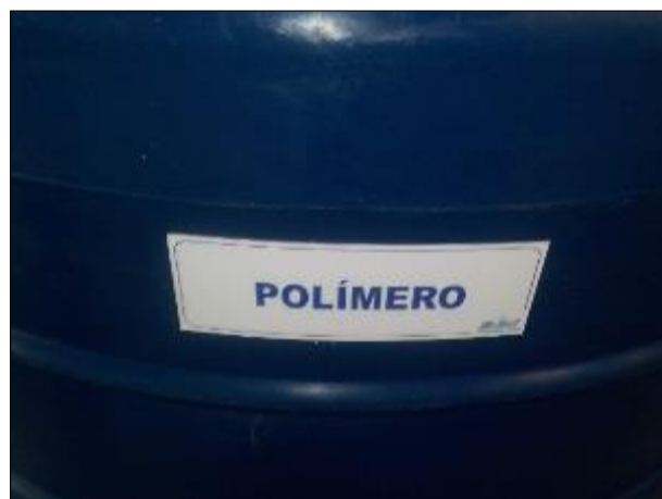
Figura 41: Vista em detalhe da placa afixada no recipiente contendo o Polímero.