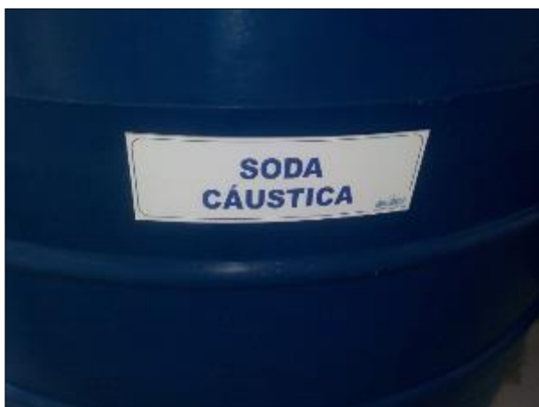
Figura 40: Vista em detalhe da placa afixada no recipiente contendo a Soda Cáustica.