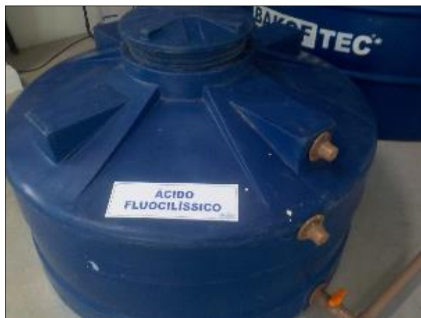
Figura 39: Vista em detalhe do recipiente contendo o Ácido Fluossilícico.