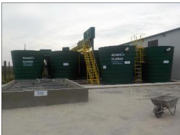
Figura 8: Vista da ETA II, já em funcionamento, com seus equipamentos de material fibra de vidro.

Os equipamentos são fabricados em PRFV, popularmente conhecido como fibra de vidro, e segundo informado pela Concessionária têm baixo custo operacional e facilidade de controle. Estão dispostos em terreno alugado, porém ainda sem comprovação documental deste aluguel. O painel de energia fotovoltaica instalado na área superior do prédio que comporta o laboratório, filtros e casa de química trará energia quase autossuficiente para a operação.