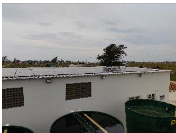
Figura 29: Vista dos painéis de energia fotovoltaica instalados na área superior do prédio adjacente.