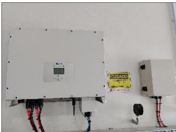
Figura 34: Vista dos equipamentos disponíveis na edificação em boas condições.