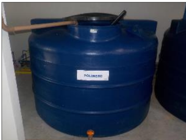
Figura 42: Vista em detalhe do recipiente contendo o Polímero.