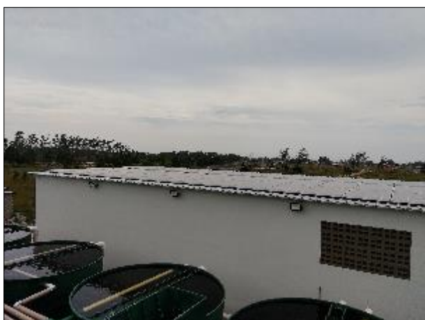
Figura 28: Vista dos painéis de energia fotovoltaica instalados na área superior do prédio adjacente.