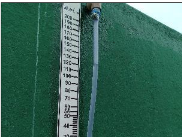
Figura 16: Medidor de vazão em bom estado de conservação, indicando a vazão de aproximadamente 120 m 3 /h na ETA II.