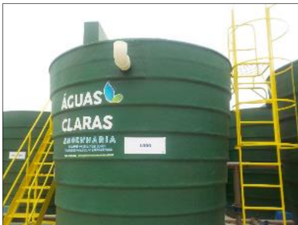
Figura 18: Compartimento que faz o adensamento do lodo.