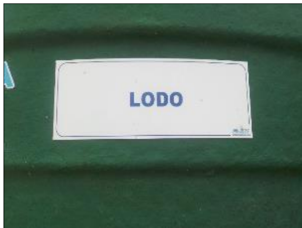
Figura 19: Vista da placa indicativa do equipamento.