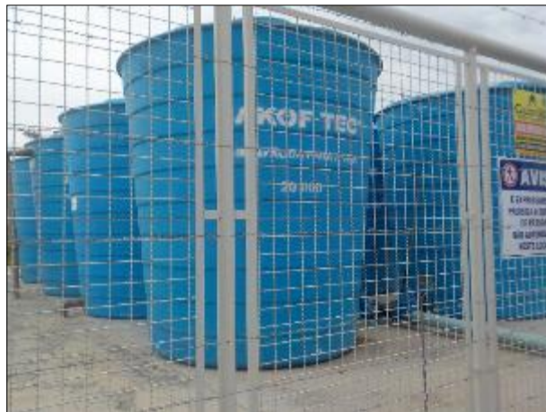
Figura 47: Vista, a partir da área externa, do local onde estão instalados os oito reservatórios de 20.000 litros.