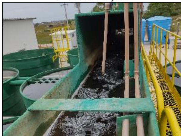
Figura 11: Vista de parte da entrada de água bruta para tratamento na ETA, Calha Parshall e dosagem de produtos químicos.