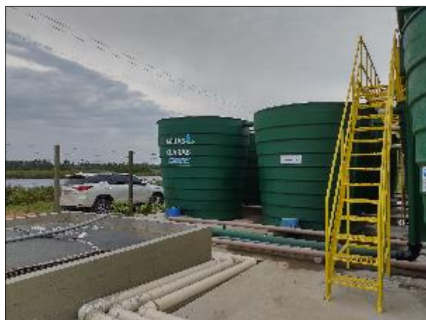
Figura 9: Vista das escadas de acesso à área superior da ETA II, com pintura e corrimões em boas condições.