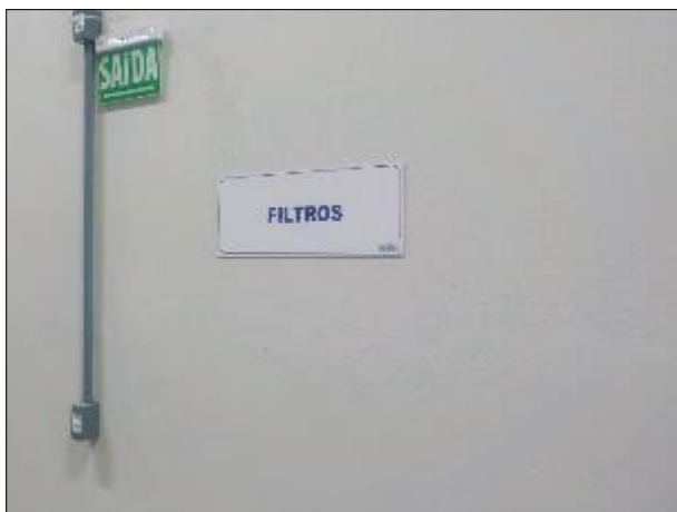
Figura 44: Placas indicativas na área dos filtros.