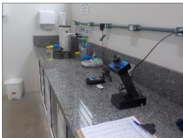
Figura 33: Vista em detalhe da bancada do laboratório, em boas condições.