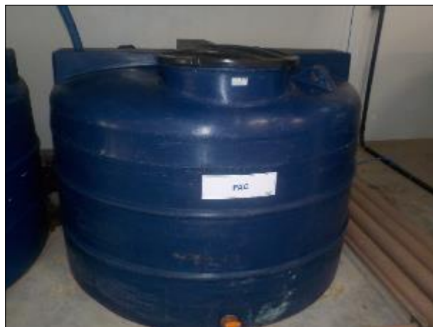
Figura 43: Vista em detalhe do recipiente contendo o Policloreto de Alumínio (PAC).