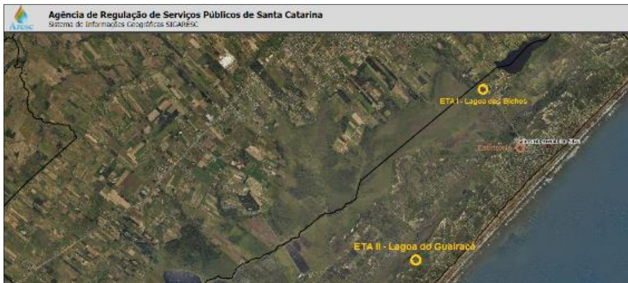
Figura 1: Localização das unidades ETA I – Lagoa dos Bichos e ETA II – Lagoa do Guairacá, destaca-se esta última que é uma nova unidade ao Sul da área urbana do município de Balneário Arroio do Silva.

Na reunião presencial no Escritório da Concessionária a Equipe técnica da Aresc foi informada que a Outorga de Uso da Água ainda não estava disponível para a unidade, apenas a licença ambiental de operação - LAO, no entanto não foi enviada para esta Agência de Regulação até o presente momento. A visita na unidade foi realizada na manhã do mesmo dia 17 de março de 2021, estando localizada na Rua Elza Nazário da Silva, s/n, ao Sul da área urbana municipal, como podemos observar na imagem a seguir: