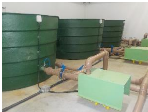
Figura 45: Vista em detalhe dos filtros, protegidos na edificação e em boas condições.