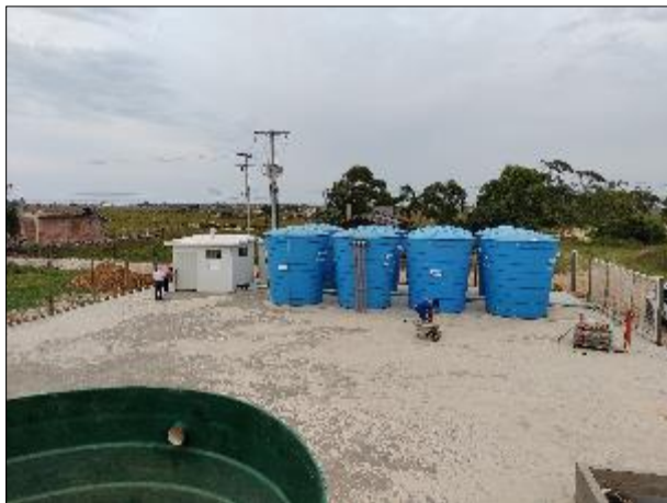
Figura 46: Vista dos reservatórios (à direita, azul) e do local onde está a ERAT (à esquerda, edificação branca)

O reservatório da ETA II tem capacidade de reservar 160 m 3 de água tratada e a Estação de Recalque de Água Tratada (ERAT) tem duas bombas com 30 cv, sendo uma destas reserva.