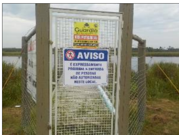
Figura 5: Portão de acesso ao local onde está a ERAB, com sinalização e cercamento adequados.