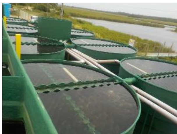
Figura 15: Vista dos decantadores, estes que ficam no entorno da calha de floculação e recebem suas águas.