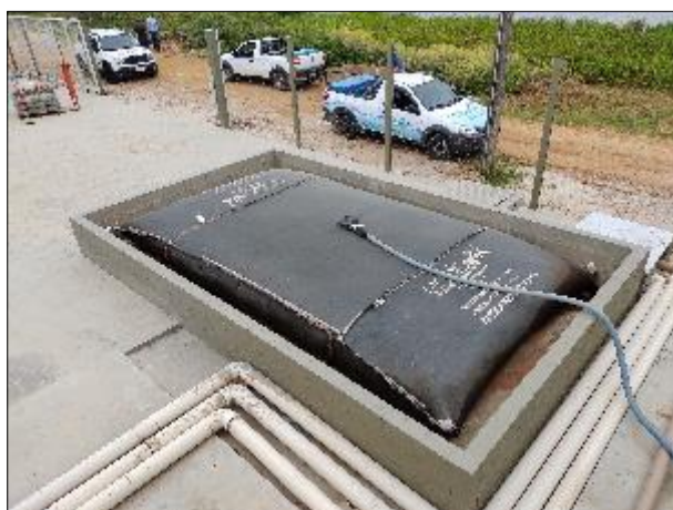
Figura 27: Vista aérea do saco para descarte do lodo.