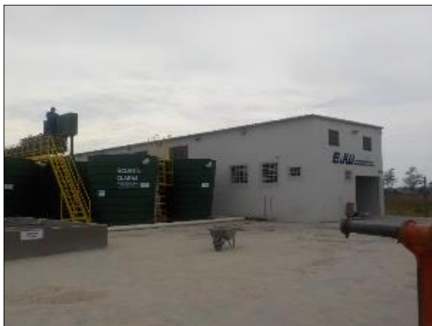
Figura 30: Vista da edificação onde estão localizados o laboratório, filtros e casa de química, ao fundo.