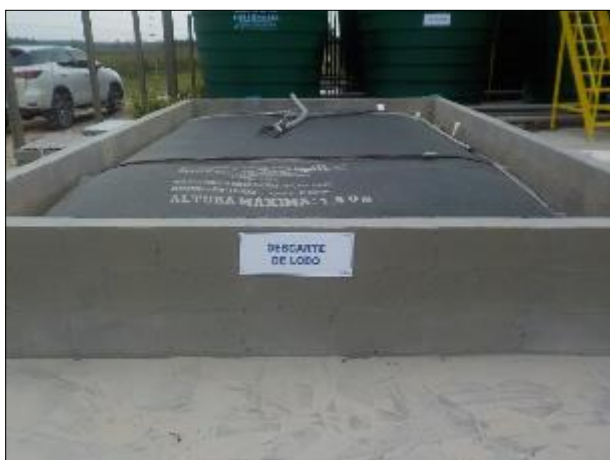
Figura 26: Vista do saco para o descarte do lodo disponível na ETA II.