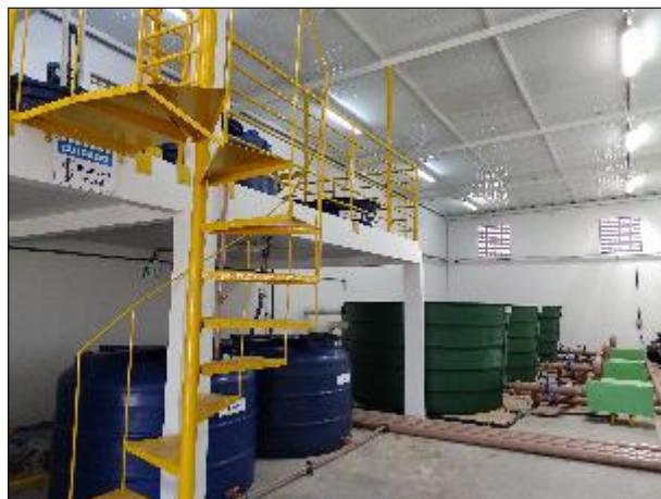
Figura 37: Vista da escada de acesso em boas condições e ao fundo os filtros.