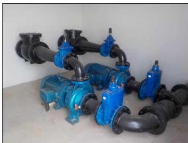
Figura 51: Vista das bombas de 30 cv disponíveis para recalque da água tratada, uma delas reserva.