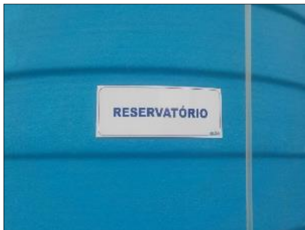
Figura 49: Vista em detalhe da placa indicativa do reservatório.