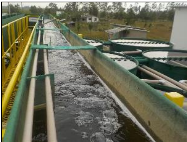
Figura 12: Vista da calha de floculação, onde ocorre a mistura dos produtos químicos na água bruta.