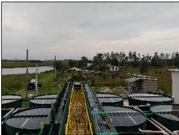
Figura 24: Vista superior da passarela de apoio, calha de floculação (ao centro) e decantadores (nas laterais). Ao fundo a Lagoa do Guairacá.