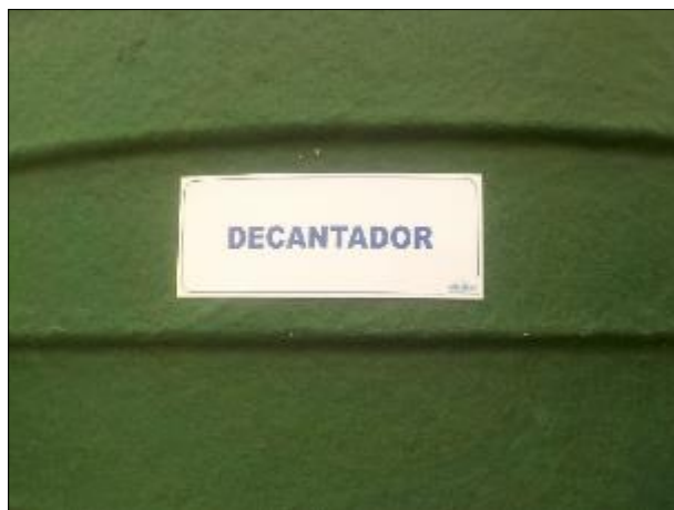
Figura 21: Vista da placa indicativa em detalhe.