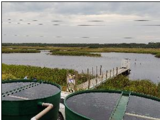
Figura 2: Ao fundo a Lagoa do Guairacá, manancial de captação de água bruta local.

A Captação na Lagoa do Guairacá, segundo informado pela Concessionária, pode fornecer até 65 L/s de água bruta e possui duas bombas de 7,5 cv para fazer o recalque para a ETA II, que, como poderá ser observado nas imagens abaixo, fica próxima e está devidamente protegida com cercamento e placas indicativas.