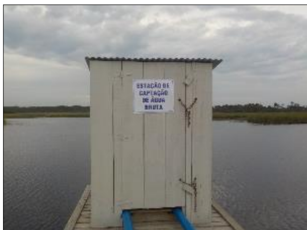
Figura 6: Vista externa do local onde está localizada a ERAB Lagoa do Guairacá.