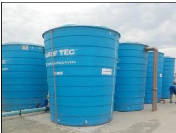
Figura 48: Vista dos reservatórios em boas condições de higiene e estanqueidade.