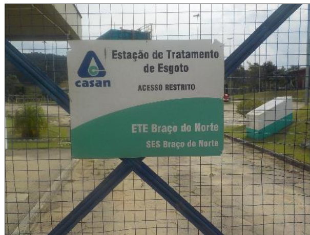
Figura 19: Vista em detalhe da placa indicativa da unidade instalada no portão de acesso de veículos à ETE Braço do Norte.