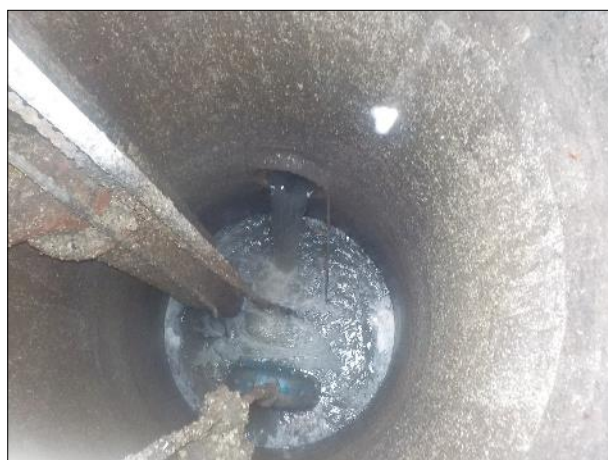
Figura 15: Vista do interior da EEE C1, boas condições de limpeza e conservação.