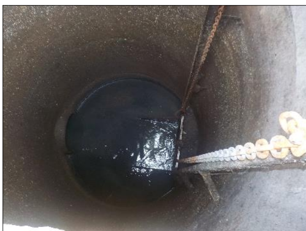
Figura 16: Vista do interior da EEE C1, gradeamento em boas condições de limpeza e conservação.