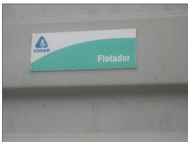
Figura 39: Vista da placa afixada indicando que aquela unidade é denominada Flotador.