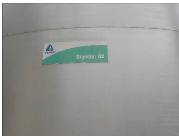
Figura 33: Vista aproximada da placa afixada no equipamento digestor anaeróbico.