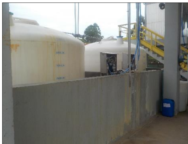
Figura 45: Vista de parte da estrutura da ETE Braço do Norte, em boas condições de operação.