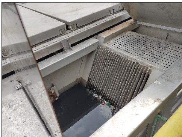
Figura 24: Vista do gradeamento na entrada do esgoto da ETE, pertencente ao tratamento preliminar.