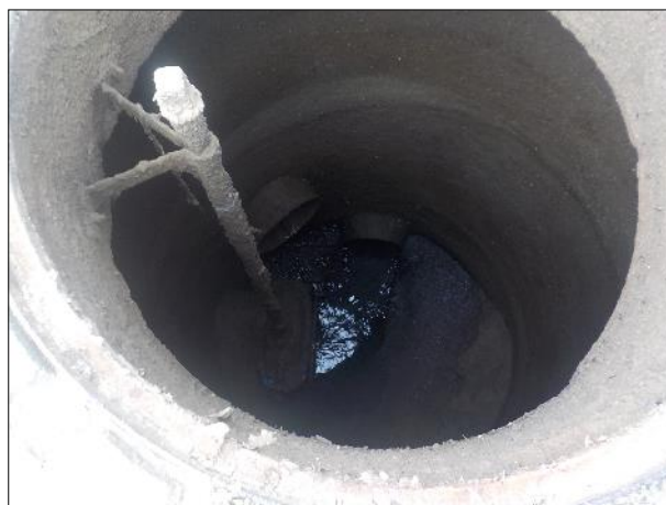
Figura 5: Vista do interior de um dos poços de visita do SES, especificamente da EEE C2.