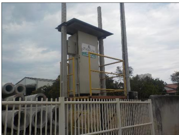
Figura 2: Vista da central de comando da EEE C2, dentro de área cercada; e como está em local elevado possui guarda-corpo.

gerais de funcionamento, higiene e segurança.