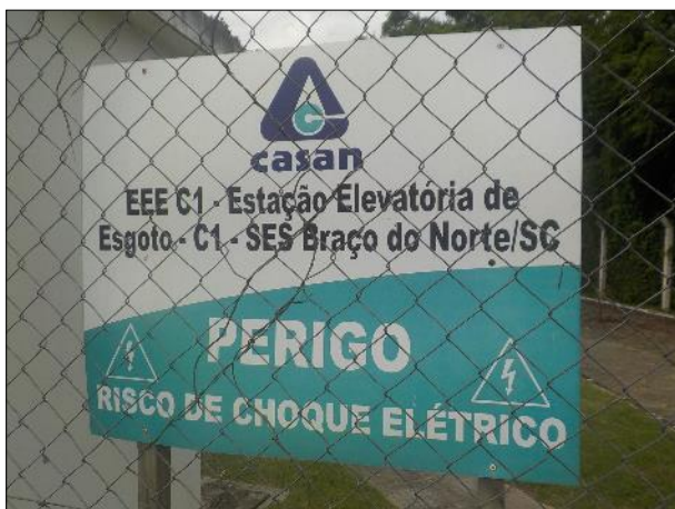
Figura 10: Vista da placa indicativa da EEE C1, esta contendo também o alerta de perigo para energia elétrica.

Na EEE C1 a Equipe Técnica da Aresc encontrou a placa informativa e de advertência afixada na unidade, figura 10, bem como pintura da unidade com a indicação e as cores da concessionária, figura 11, assim como uma boa estrutura no terreno e nos equipamentos, estes em boas condições gerais de funcionamento, higiene e segurança.