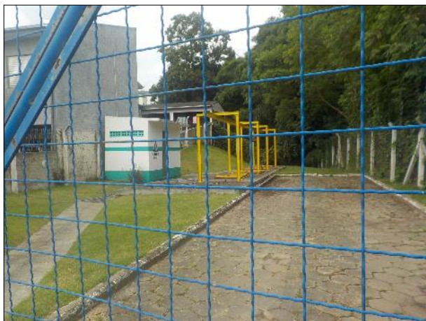
Figura 12: Vista geral do local onde está instalada a EEE C1, cercamento e portões em boas condições e manutenção adequada.