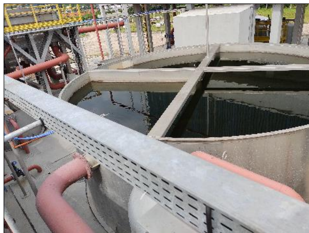
Figura 31: Vista do tanque de contato da ETE, em boas condições de operação.