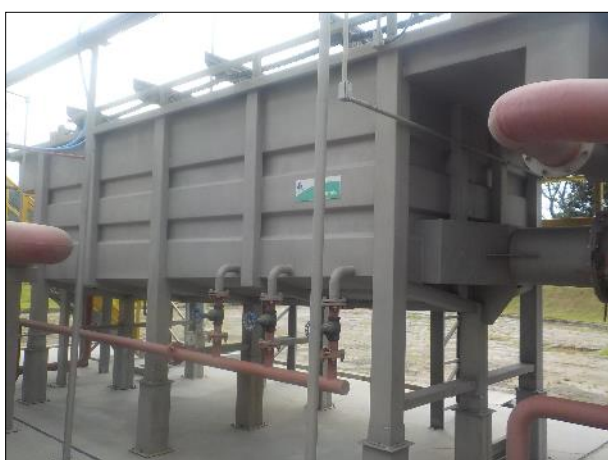
Figura 38: Vista externa do tanque de flotação da ETE Braço do Norte, em boas condições.