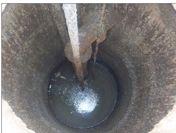
Figura 6: Vista do interior da EEE C2, boas condições de limpeza e conservação.