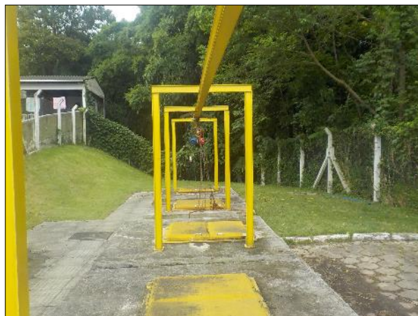
Figura 13: Vista da monovia, estrutura instalada para fazer manobras nas bombas e no gradeamento nos poços.