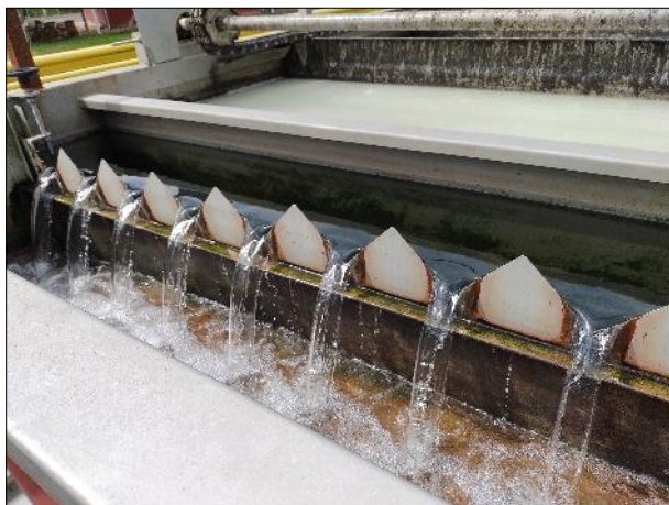
Figura 30: Vista em detalhe do líquido clarificado saindo da etapa de flotação.