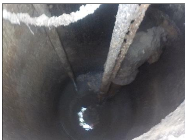
Figura 7: Vista do interior da EEE C2, boas condições de limpeza e conservação.