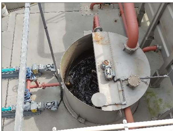
Figura 28: Vista superior do tanque de lodo flotado, em boas condições.