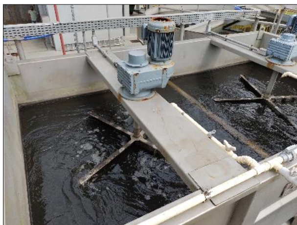
Figura 29: Vista dos tanques de floculação mecânica da ETE Braço do Norte, em boas condições.