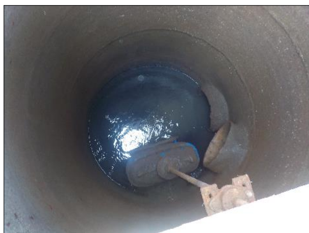
Figura 17: Vista do interior da EEE C1, boas condições de limpeza e conservação.