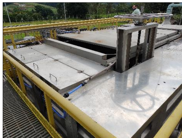
Figura 23: Parte superior do tratamento preliminar disponível na ETE, contendo diversos gradeamentos para retirada de sólidos antes do início do tratamento químico.