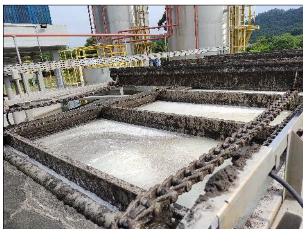
Figura 27: Vista da estrutura da ETE Braço do Norte, flotor e raspadores de lodo em boas condições operacionais.