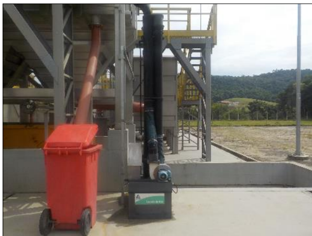
Figura 42: Vista de parte da estrutura do lavador de gás, boas condições operacionais.