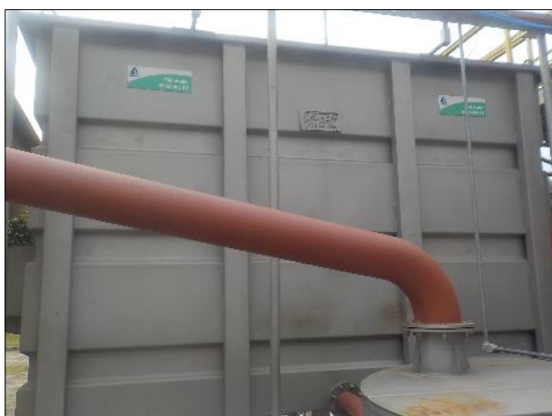
Figura 40: Vista externa do tanque de floculação.