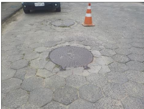
Figura 4: Vista geral das tampas do sistema de inspeção do SES em frente à central de comando da EEE C2.