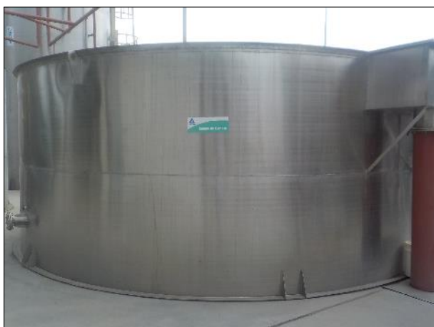
Figura 34: Vista lateral do Tanque de Contato, estrutura em boas condições e contendo placa indicativa.