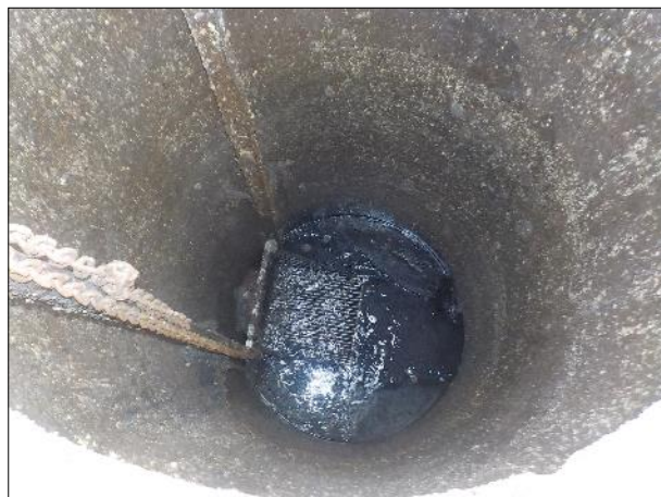
Figura 9: Vista do poço onde está instalado o gradeamento da EEE C2, boas condições de higiene e conservação.