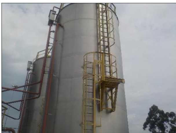
Figura 32: Vista dos digestores anaeróbicos disponíveis na ETE Braço do Norte.