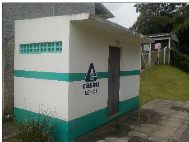
Figura 11: Vista da edificação onde estão localizados os painéis elétrico e de comando da EEE C1.