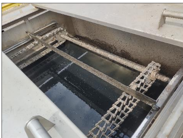
Figura 26: Vista da estrutura de tratamento preliminar da ETE de Braço do Norte, em boas condições.