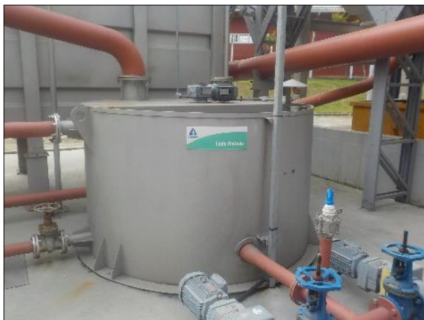
Figura 36: Vista lateral do Tanque de Lodo Flotado, equipamento em boas condições e com placa informativa.