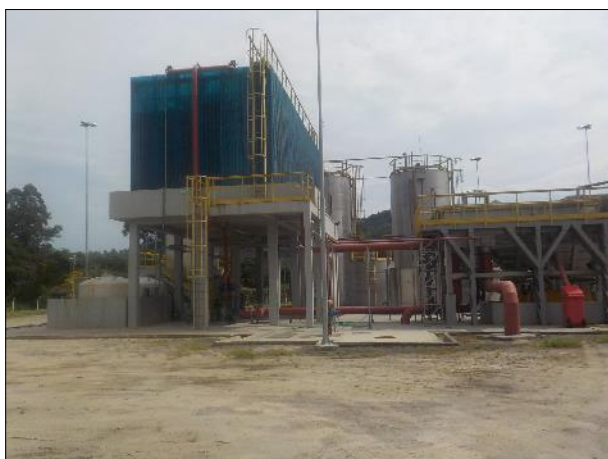
Figura 20: Vista geral da ETE a partir da via de acesso principal, filtro biológico à esquerda (estrutura azul).