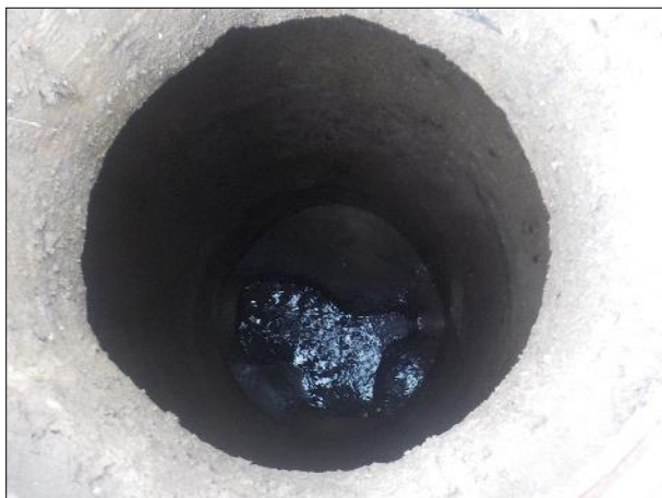
Figura 8: Vista do poço com boas condições de limpeza.