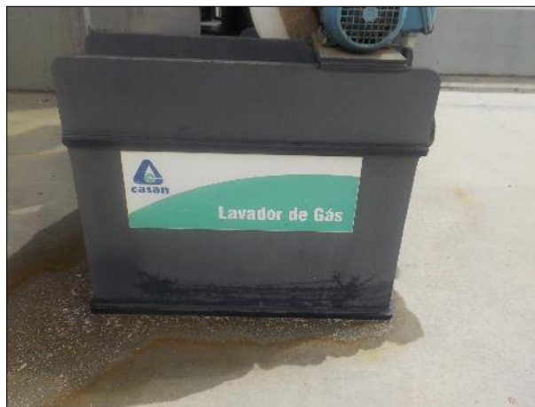
Figura 43: Vista em detalhe da placa informativa da unidade.