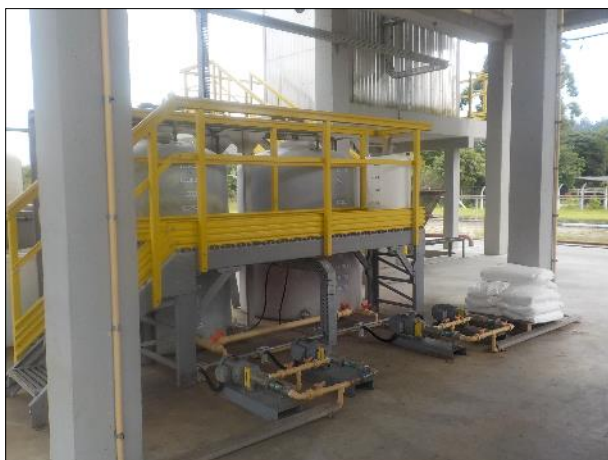
Figura 44: Vista da estrutura onde estão instalados os tanques de armazenamento dos produtos químicos utilizados na ETE braço do Norte.