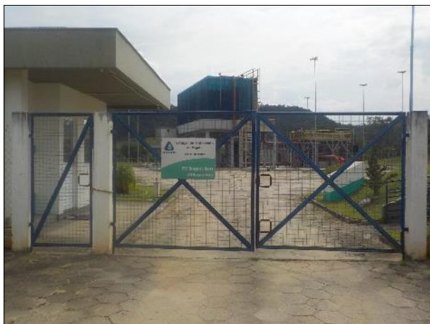
Figura 18: Vista dos portões de entrada da ETE Braço do Norte.

bem como em seu portão de entrada, figuras 18 e 19, a placa indicativa e de restrição de acesso à unidade.