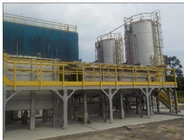
Figura 21: Vista lateral da ETE Braço do Norte, ao fundo os digestores, em primeiro plano os floculadores e flotor e a passarela de acesso.