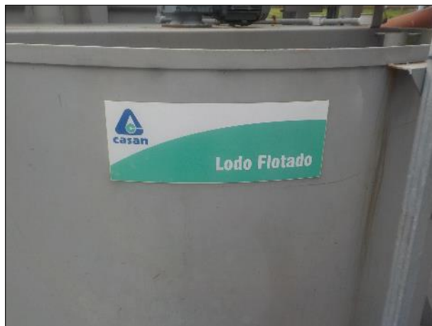
Figura 37: Vista da placa afixada na unidade, boas condições.