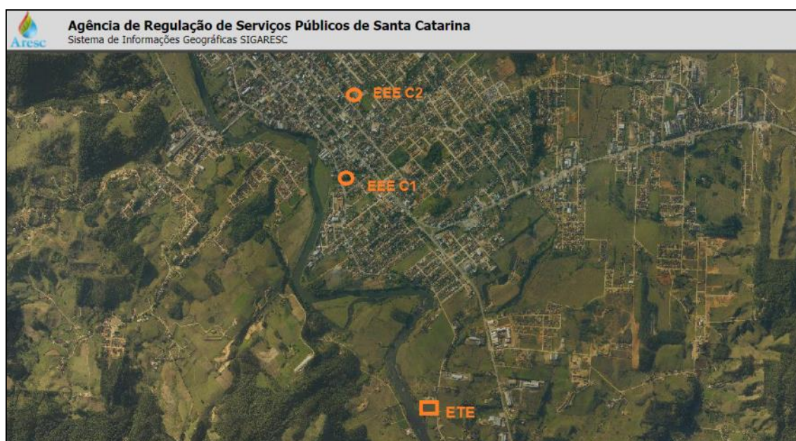
Figura 1: Localização das unidades do SES do município de Braço do Norte.

A imagem a seguir, figura 1, mostra a localização das unidades visitadas dentro da área urbana do município de Braço do Norte: