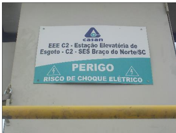
Figura 3: Vista em detalhe da placa indicativa da unidade e informativa de eletricidade.