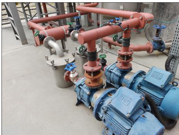
Figura 22: Bombas disponíveis, em bom estado, para realizarem a retorno de parte do lodo para reinserção no sistema da ETE.