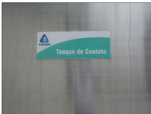
Figura 35: Vista detalhada da placa indicativa da unidade.