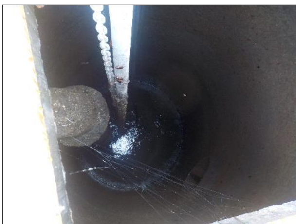
Figura 14: Vista do interior da EEE C1, boas condições de limpeza e conservação.