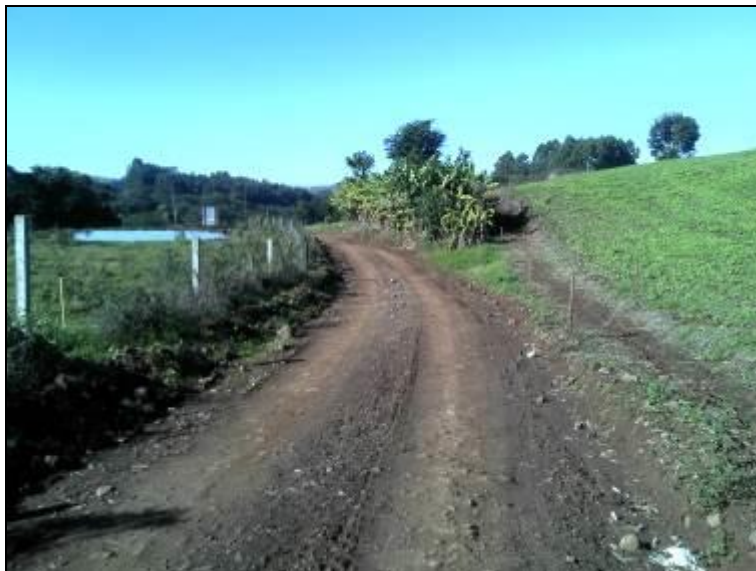
Figura 1: Acesso ao aterro e escritório

6) As instalações são vigiadas 24 horas por dia? Sim ( ) Não (x)