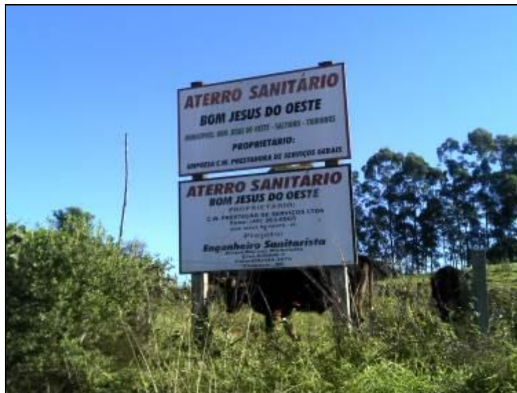
Figura 2: Placas de identificação