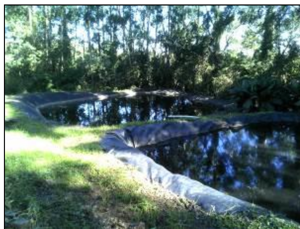
Figura 6: Sistema de tratamento

4) As tubulações do sistema de drenagem estão em boas condições? (sem vazamento, corrosões) Sim (x) Não ( ) - Em caso negativo, qual o destino do Chorume? R.: _____