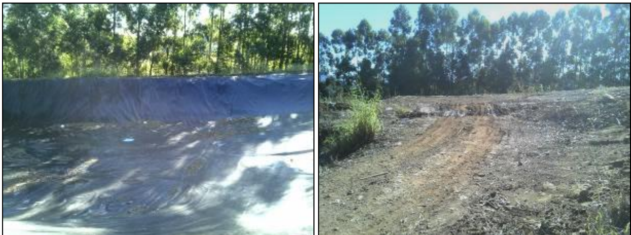
Figura 5: Área do Aterro Sanitário

RECOMENDAÇÃO 12: Apresenta cópias das licenças ambientais vigentes.