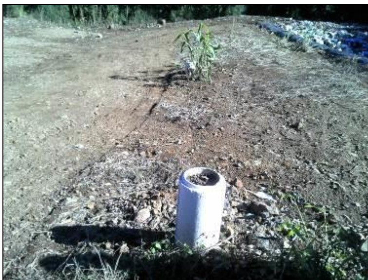
Figura 7: Queimadores de Gás sem queima

1) Existem queimadores e controle de emissões? Sim (x) Não ( ) Obs.: Sem aproveitamento, sem queima.