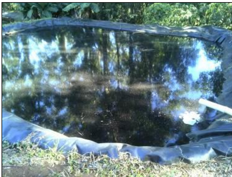
Figura 5: Sistemas de drenagem/tratamento

2) Existe sistema de drenagem do chorume? Sim (x) Não ( )