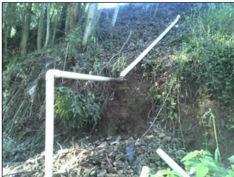
Figura 4: Drenagem de águas superficiais

1) Existe drenagem de água e de gases no A.S.? Sim (x) Não ( )