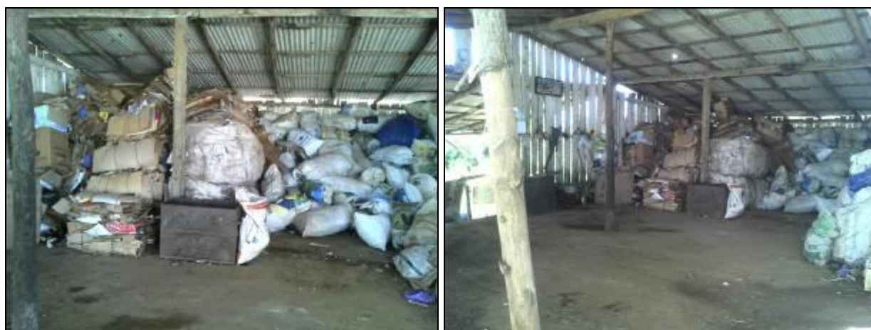
Figura 2: Galpão de triagem

RECOMENDAÇÃO 09: Estudar a possibilidade de melhorar o local de triagem.