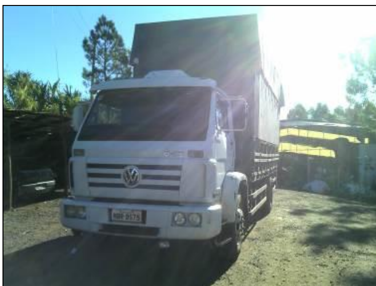
Figura 1: Caminhões que operaram no Aterro Sanitário

4) Quantos municípios são atendidos no A.S. 2 ? R.: _____