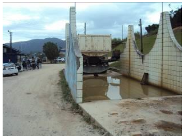
Panoramas da Entrada principal da Empresa