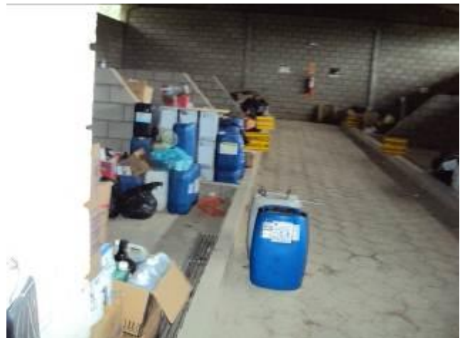
Área de tratamento de resíduos de saúde