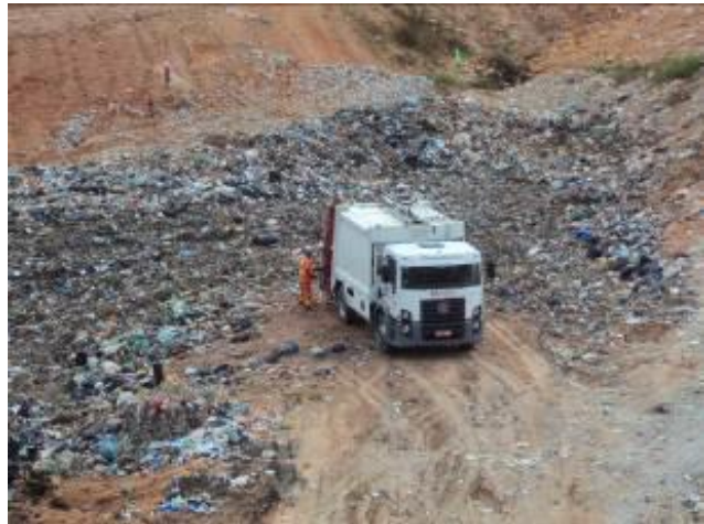
Visão da área de frente de trabalho do A.S. – Proactiva

18) Em caso positivo, a triagem é realizada em local apropriado? Sim ( ) Não ( ) Obs.: Não se aplica.