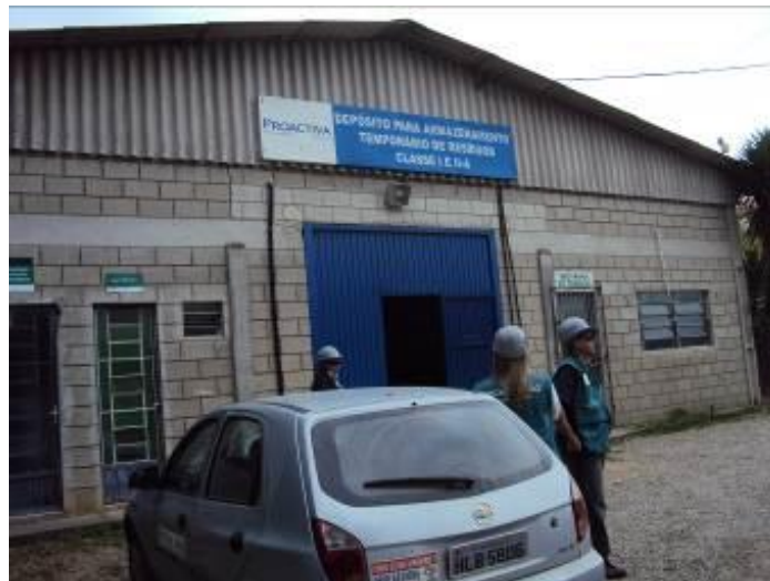
Depósito de armazenamento temporário