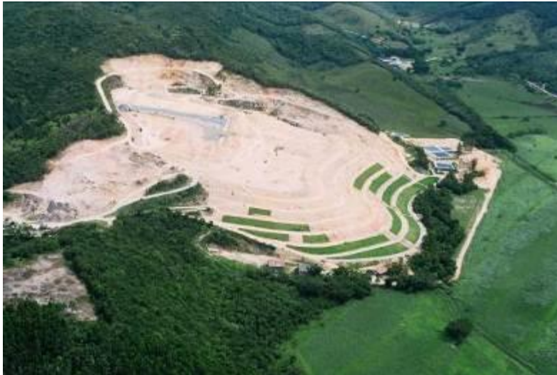
Vista aérea do Aterro Sanitário de Tijuquinhas.