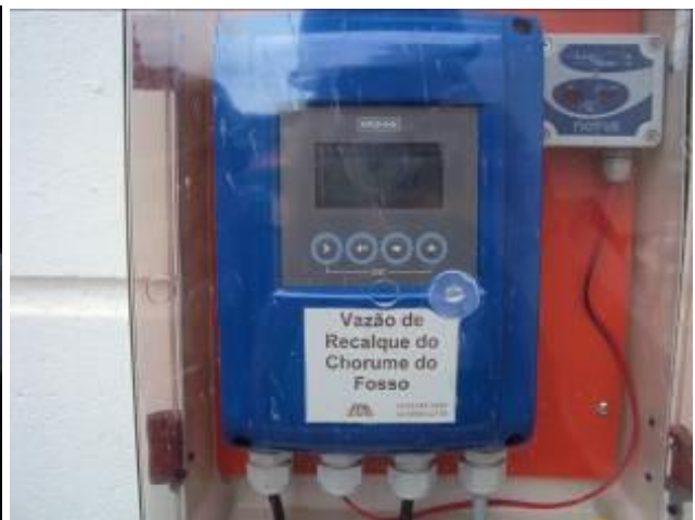
Equipamentos de controle de gases e efluentes

22) Existe algum procedimento para manter as aves distantes da área do A.S? Sim (x) Não ( )