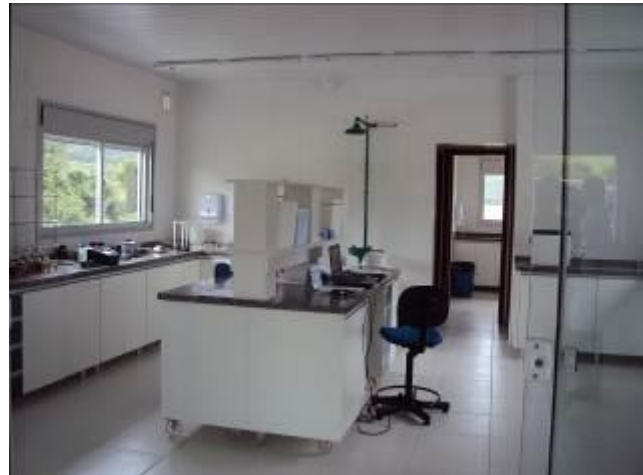
Imagens do laboratório de análises do Aterro Sanitário