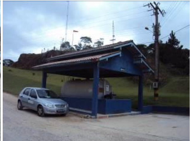
Visões da área de recepção da Proactiva-SC