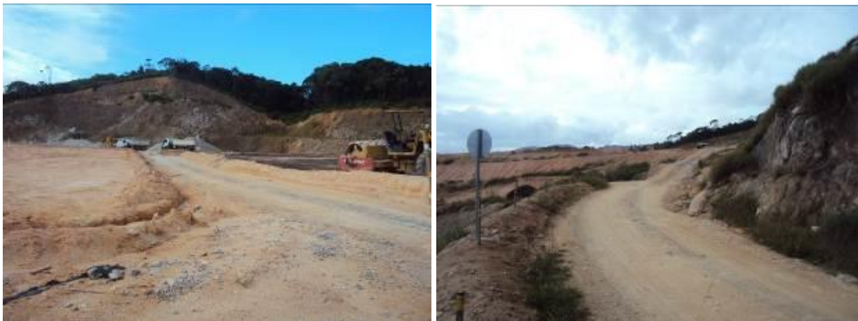
Vias de circulação interna.

25) O número de funcionários está atendendo à demanda de serviços existentes? (Anotar número de funcionários e respectivos cargos/funções). São 84 funcionários. Obs.: Não detalhado as funções/cargos.