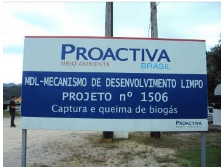
Nº do projeto de MDL aprovado pela empresa

25) O número de funcionários está atendendo à demanda de serviços existentes? (Anotar número de funcionários e respectivos cargos/funções). São 84 funcionários. Obs.: Não detalhado as funções/cargos.