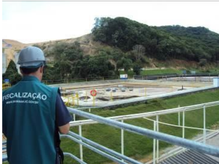
Lagoas de tratamento do chorume