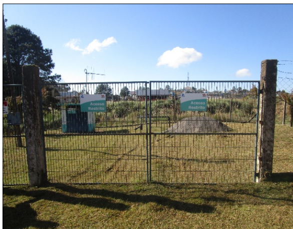
Figura 3: Placa de restrição e portões para isolamento da área.

CONCLUSÃO ARES: Foi atendido pela concessionária nesta última fiscalização de acompanhamento, conforme figuras 3 e 4 abaixo.