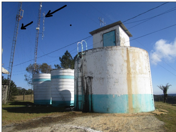
Figura 7: Indicação das antenas com para-raios.

CONCLUSÃO ARES: Como é possível verificar nas figuras 7 e 8 abaixo, há antenas de rádio no mesmo terreno, e estas possuem para-raios em um ângulo que protege os reservatórios. Portanto, essa determinação foi revista pela área técnica da Aresc e considerada atendida.