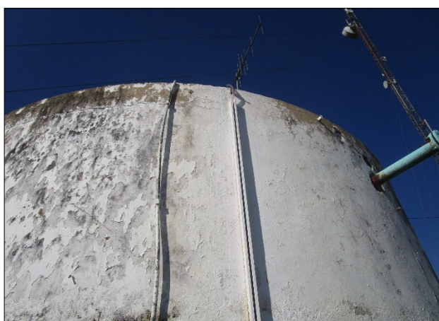
Figura 9: Mangueira precária, por ter a visualização do nível do reservatório

CONCLUSÃO ARES: Esta determinação não foi atendida pela concessionária nesta última fiscalização de acompanhamento, conforme é possível verificar nas figuras 9 e 10 abaixo), a determinação do nível encontra-se precária, infringindo o Art. 23 da Resolução Aresc n. 048/2016.