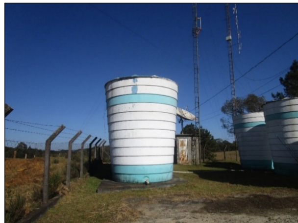
Figura 8: Vista geral do terreno com as antenas e reservatórios.

CONSTATAÇÃO: Mangueira de nível precária, com parâmetros de leitura pouco legíveis.