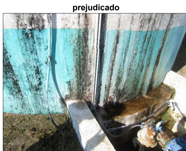
Figura 10: Detalhe da mangueira de nível, com visualização prejudicada.