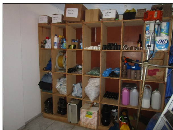
Figura 14: Almoxarifado de peças, junto ao escritório. Organizado.