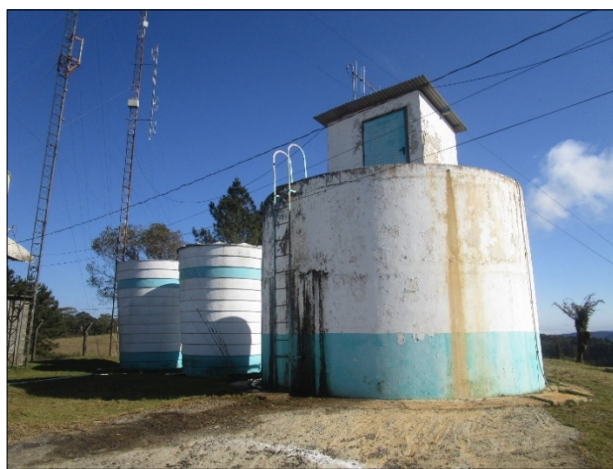
Figura 2: Almoxarifado produtos químicos