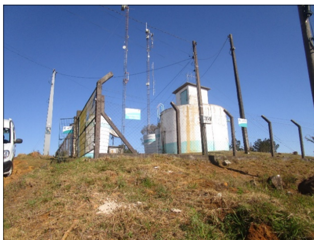
Figura 1: Almoxarifado produtos químicos

CONCLUSÃO ARESC: Esta determinação não foi atendida pela concessionária nesta última fiscalização de acompanhamento, visto que o abrigo está em local de acesso difícil e perigoso (sobre o reservatório – figuras 1 e 2 abaixo), infringindo o Art. 18, § 2º da Resolução Aresc n. 048/2016.