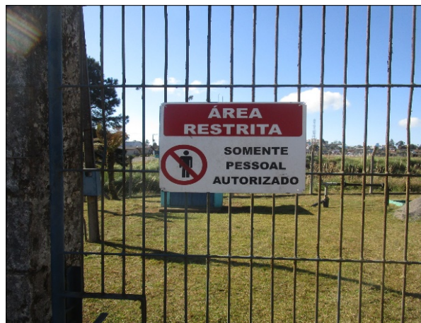
Figura 4: Placa de restrição de acesso.