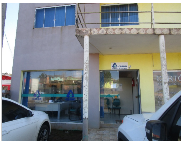
Figura 11: Escritório identificado.

CONCLUSÃO ARESC: Determinação atendida pela concessionária nesta última fiscalização de acompanhamento (escritório identificado, horário de atendimento disponível para o público, CDC e resoluções aresc disponíveis para consulta, almoxarifado geral em condições adequadas, condições de limpeza do escritório adequadas, mobília e equipamentos novos e dois funcionários para o atendimento – figuras 11 a 15).