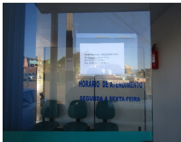
Figura 12: Horário de atendimento ao público disponível em cartaz afixado.