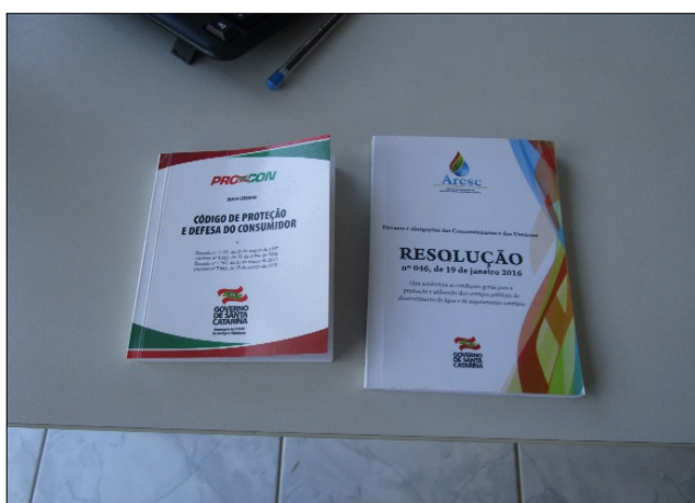
Figura 13: CDC e Resolução Aresc disponíveis para consulta dos usuários.