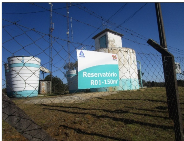
Figura 5: Placa de identificação da unidade.

CONCLUSÃO ARES: Foi atendido pela concessionária nesta última fiscalização de acompanhamento, conforme figuras 5 e 6 abaixo.