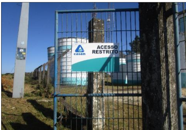
Figura 6: Placa de restrição de acesso e isolamento completo da área.