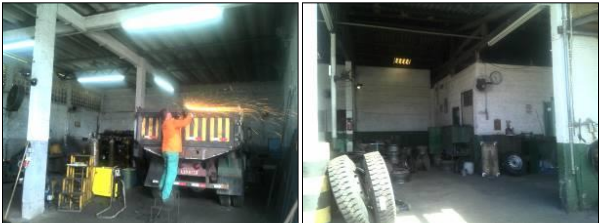
Figura 4: Unidades de apoio operacional