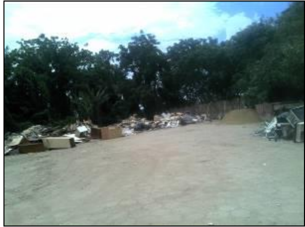
Figura 7: Área de Transbordo e Triagem