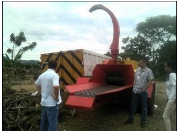
Figura 8: Área de Triagem de Podas