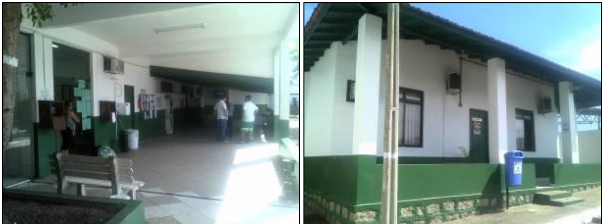
Figura 3: Refeitório e local de treinamento dos funcionários