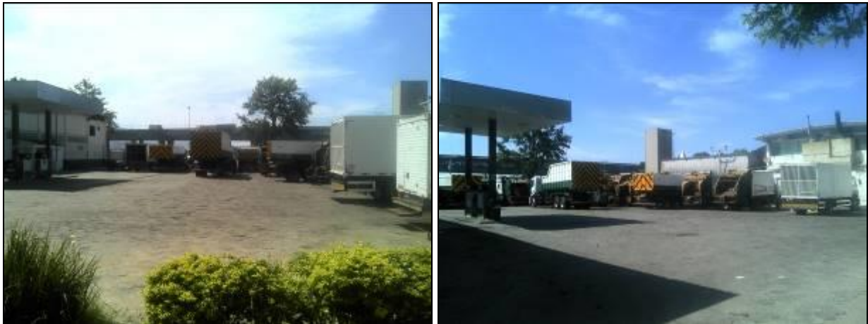
Figura 2: Pátio de estacionamento dos veículos