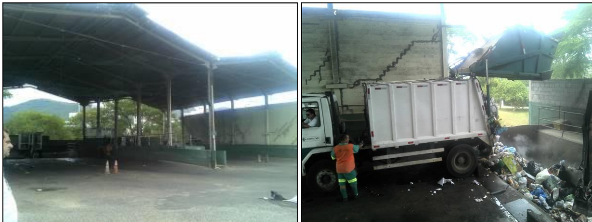
Figura 12: Transbordo