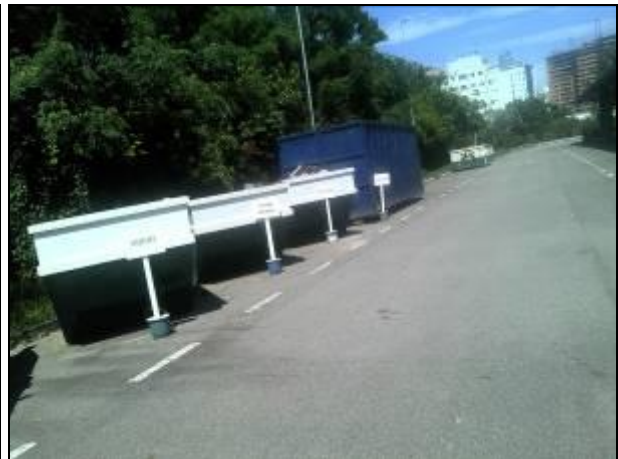
Figura 18: PEV Capoeiras