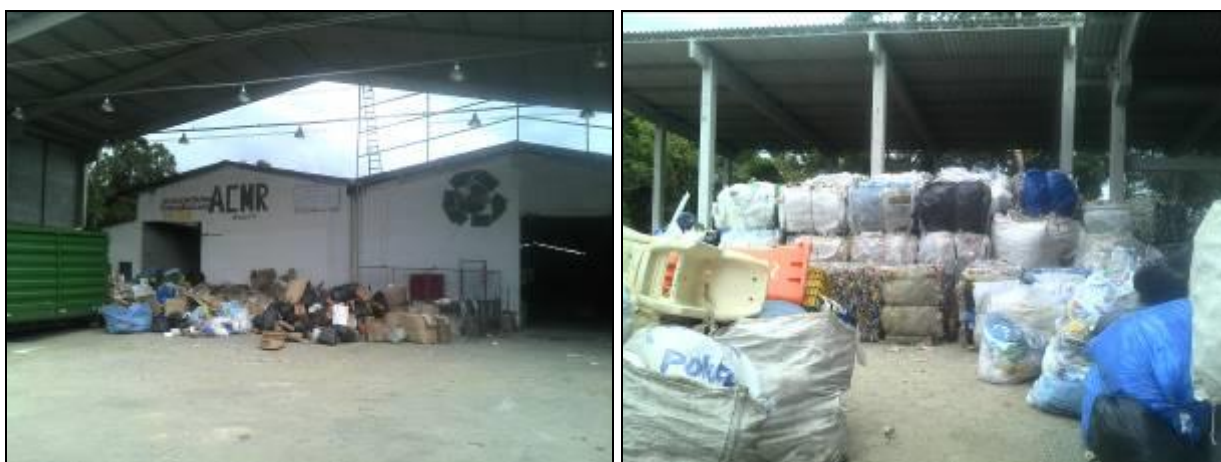
Figura 13: Associação de Coletores de Materiais Recicláveis