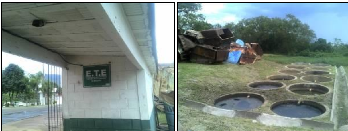
Figura 16: Estação de Tratamento de Efluentes