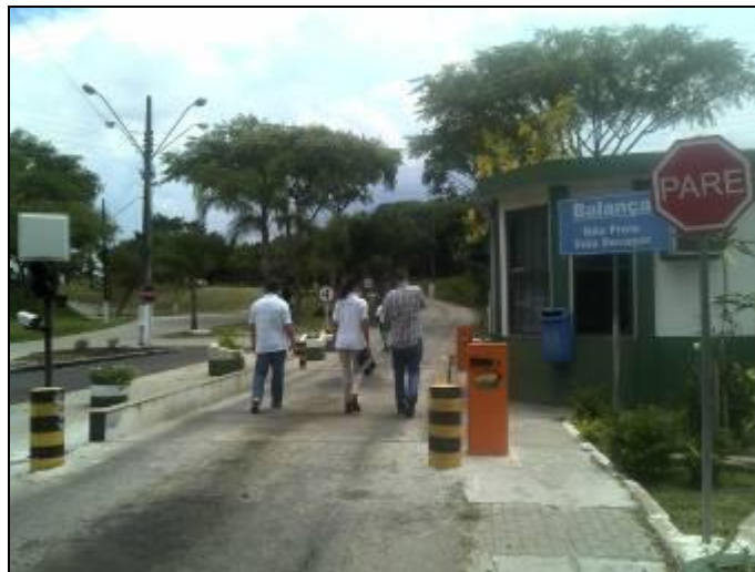
Figura 11: Balança

RECOMENDAÇÃO 08: Informar sobre a capacidade da balança.