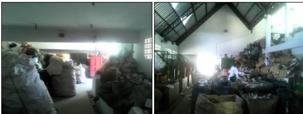
Figura 14: Centro de Reciclagem do Monte Cristo

3) Existe Licenciamento Ambiental para operação da Estação de Triagem? Sim ( ) Não ( ) –