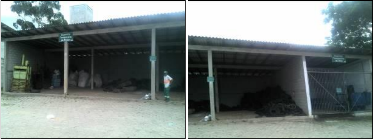
Figura 10: Depósito temporário de pneus e óleos