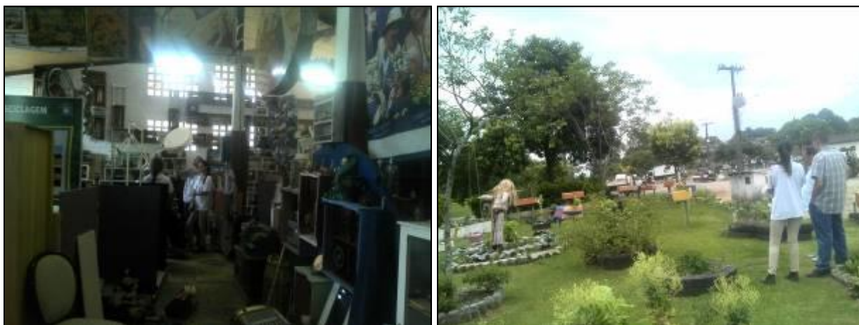
Figura 15: Museu do lixo e Horta