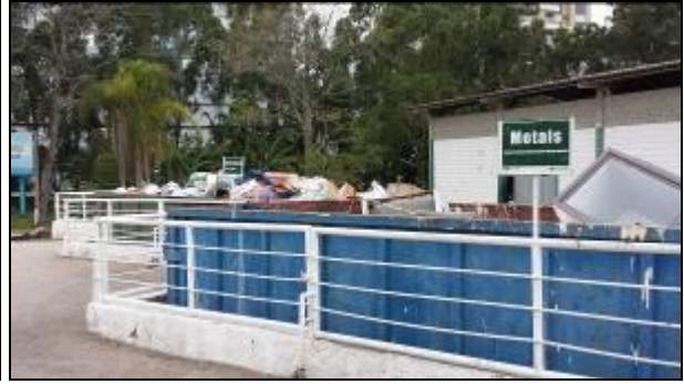
Figura 17: PEV Itacorubi