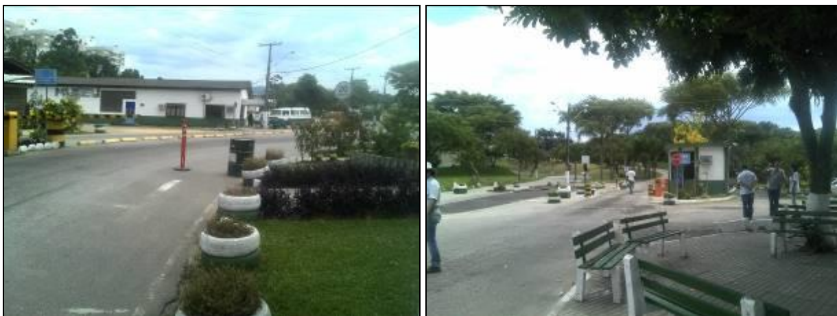
Figura 6: Acesso