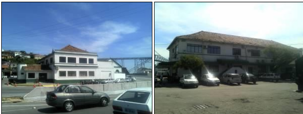
Figura 1: Vista geral do Escritório