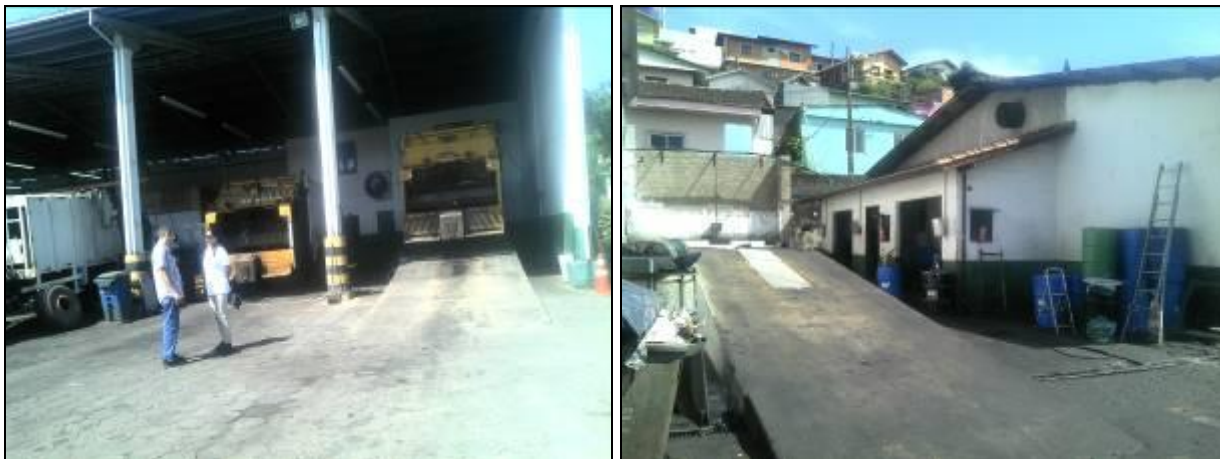
Figura 5: Unidades de apoio operacional