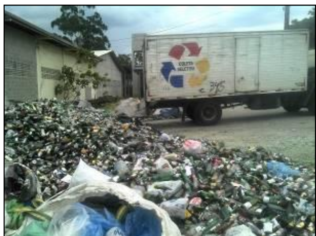
Figura 9: Depósito temporário de vidros