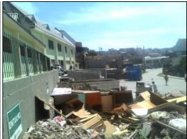
Figura 19: PEV Monte Cristo