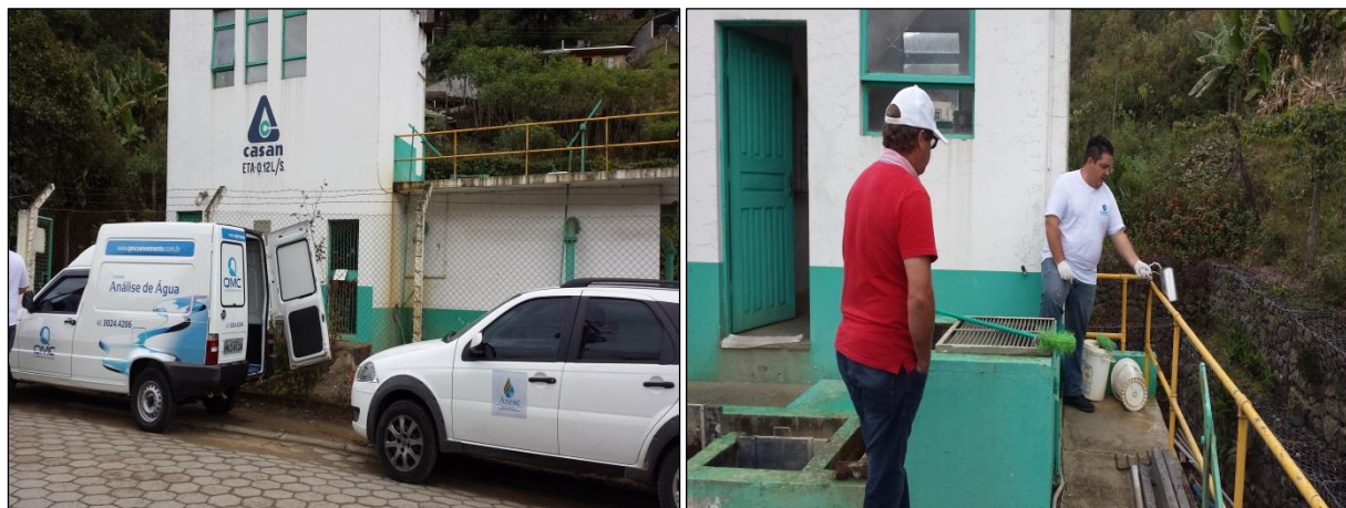
Figura 03: Coleta de amostra de água tratada na saída da ETA Alfredo Wagner

Abaixo há imagens das coletas de amostra de água tratada nas das Estações de Tratamento de Água do município de Alfredo Wagner (figuras 03 e 04).