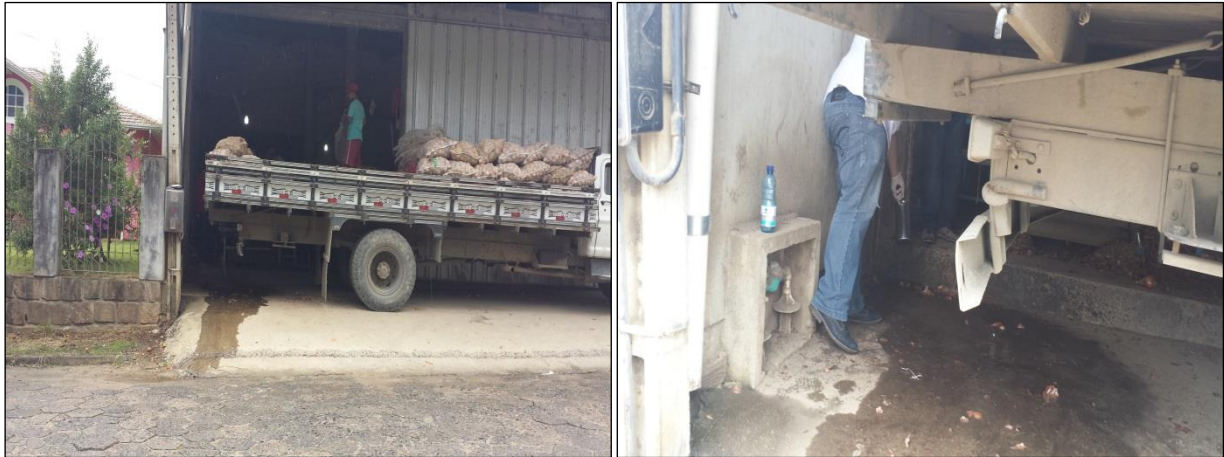
Figura 06: Coleta de amostras de água tratada na rede de distribuição: Rua Florenço de Abreu