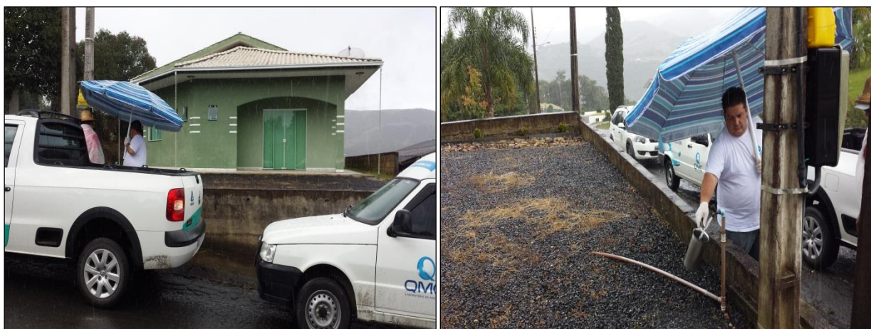
Figura 10: Coleta de amostras de água tratada na rede de distribuição: Bairro Demoras