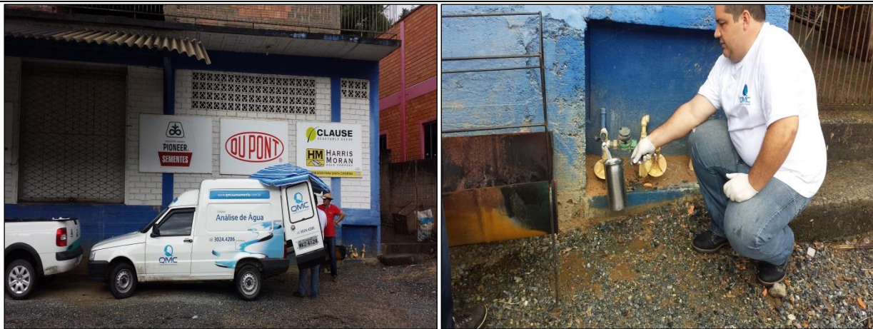
Figura 9: Coleta de amostras de água tratada na rede de distribuição: Bairro Barração