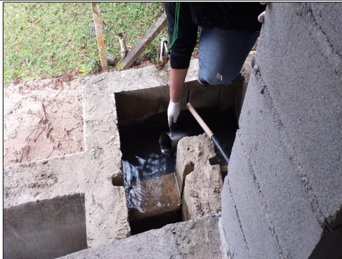
Figura 02: Coleta de amostras de água bruta na entrada da ETA Demoras