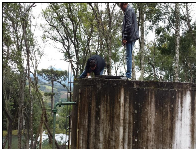
Figura 04: Coleta de amostra de água tratada na saída da ETA Demoras