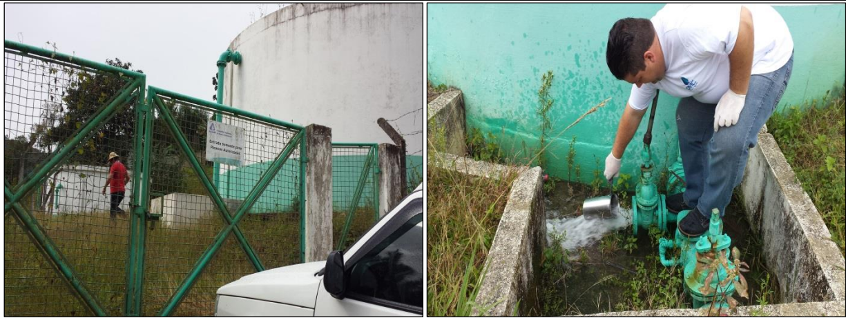
Figura 06: Coleta de amostra de água tratada no Reservatório R03