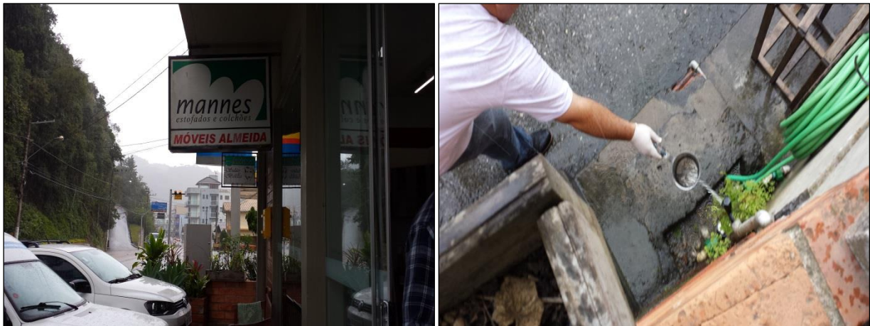
Figura 07: Coleta de amostras de água tratada na rede de distribuição: Rua do Comércio