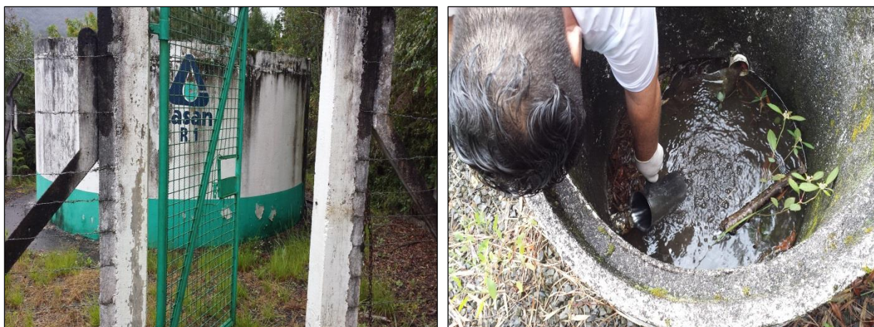
Figura 05: Coleta de amostra de água tratada próxima ao Reservatório R01

As figuras 05 a 07 mostram as coletas de amostras de água feitas nos Reservatórios citados.