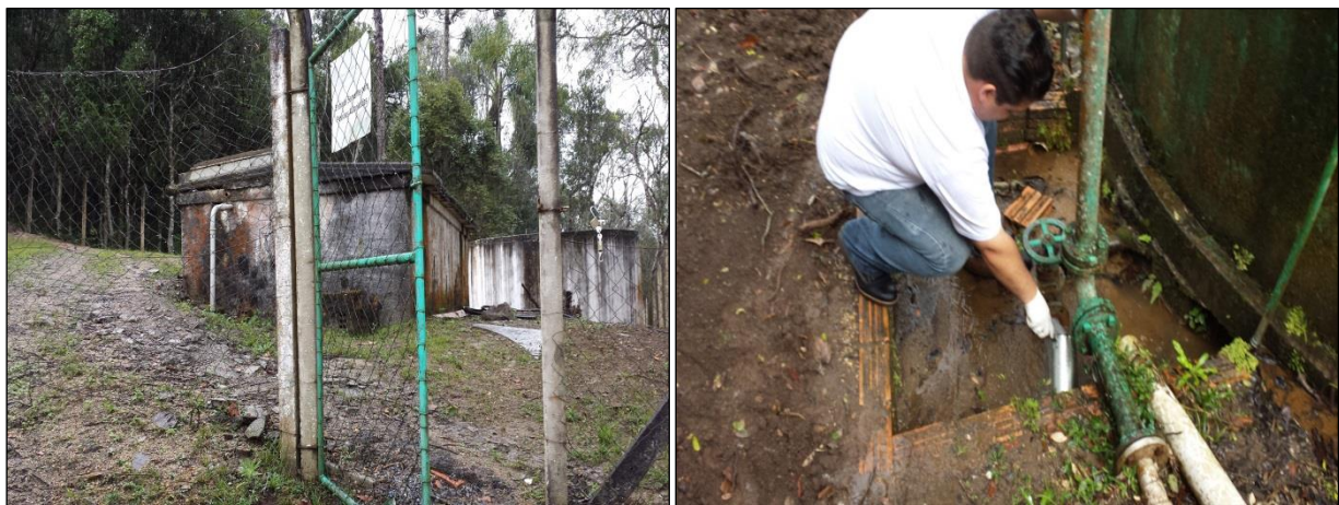
Figura 05: Coleta de amostra de água tratada próximo ao Reservatório R04