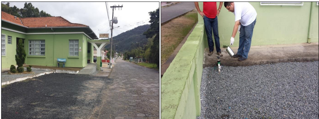
Figura 8: Coleta de amostras de água tratada na rede de distribuição: Bairro Estreito