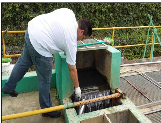
Figura 01: Coleta de amostras de água bruta na entrada da ETA Alfredo Wagner

Abaixo se encontram imagens das coletas de amostras de água bruta realizadas na entrada de cada ETA (figuras 01 e 02).