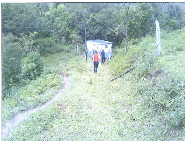
Figura 1: Acesso à captação Rio Guabiroba

Desta forma, as recomendações e observações quanto aos mananciais de captação foram atendidas parcialmente pela concessionária nesta última fiscalização, visto que o Rio Cachoeiro não havia acesso.