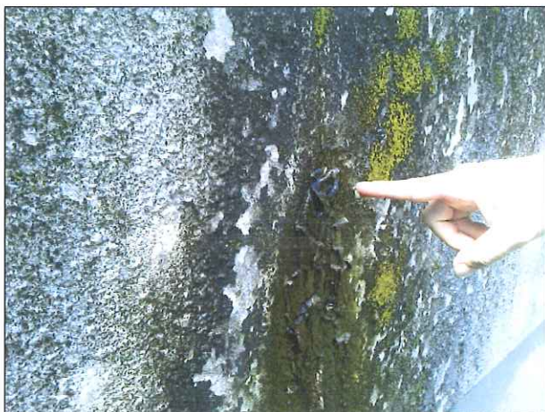
Figura 10: Infiltrações