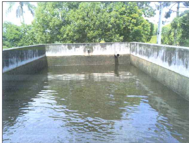
Figura 9: Filtro lento