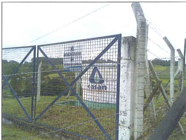
Figura 12: Reservatório Rio Guabiroba

Desta forma, as recomendações e observações foram atendidas parcialmente pela concessionária nesta última fiscalização, conforme figuras 12 a 16.