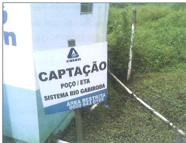
Figura 3: Placa de identificação da captação do Rio Guabirola