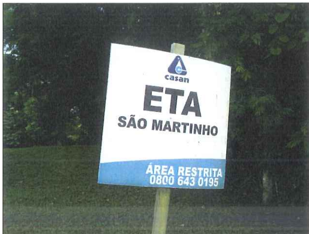
Figura 6: Placa de identificação da ETA

concessionária nesta última fiscalização, conforme figuras 6 a 11.