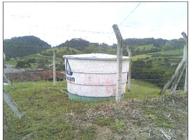
Figura 13: Reservatório Rio Guabiroba