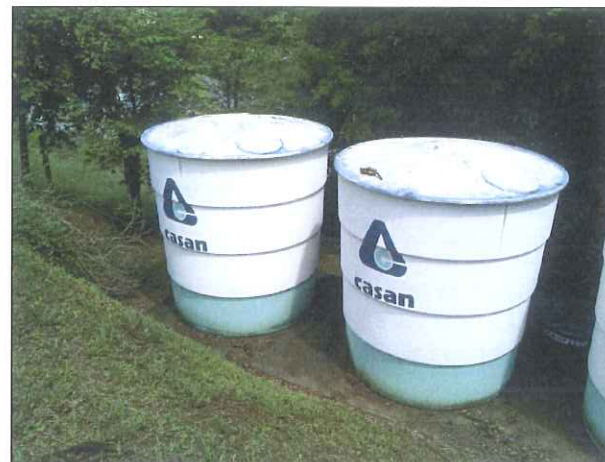
Figura 15: Reservatórios adjacentes à ETA