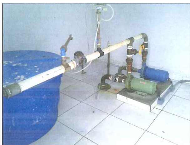
Figura 4: Poço do Rio Guabirola