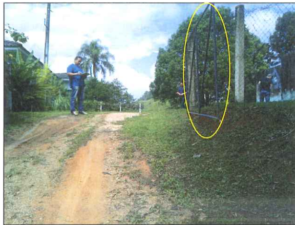
Figura 7: Portão de entrada sem cerca de proteção.