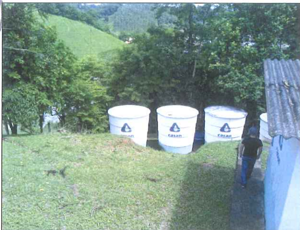
Figura 14: Reservatórios adjacentes à ETA