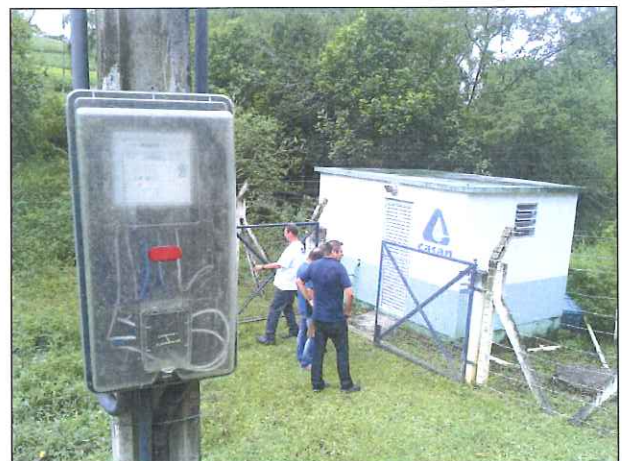
Figura 2: Vista da captação do Rio Guabiroba