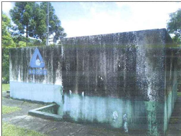
Figura 8: Filtro lento