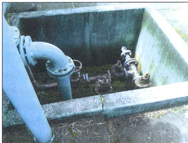
Figura 11: Ausência de gradeamento nos registros e válvulas