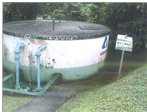
Figura 16: Reservatório R01